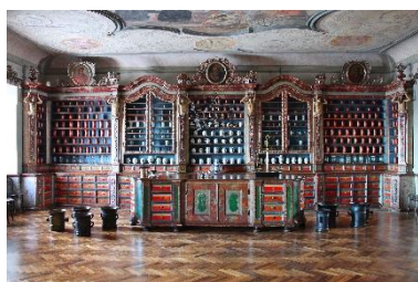
Obnova podlahy barokní lékárny na Kukuš

Na konci roku 2018 byly dokončeny práce na obnově dřevěné parketové podlahy v barokní lékárně U Granátového jablka a s ní sousedící přípravné laboratorní místnosti. Po odstranění koberce, po kterém se v průběhu předchozích sezón pohybovali návštěvníci, muselo dojít k šetrnému zbrúsení svrchních částí parket včetně odstranění celoplošného lepidla, jímž byl v minulosti koberec k podlaze připevněn. Po pečlivém zbrúsení těchto podlah byl aplikován transparentní olejový nátěr a následně navoskován. V nadcházející sezoně správa nemocnice připravuje prezentovat tento jedinečný prostor ve své původní podobě s doplněním stávajícího mobiliáře.