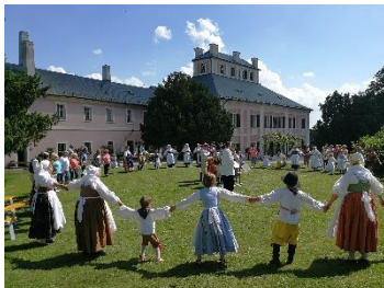
Majáles na zámku v Ratibořicích

Za rok 2018 bylo pro návštěvníky vydáno celkem 100 dárkových poukazů na prohlídky objektů ve správě ÚPS na Sychrově.