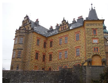
Obnova krovu střechy a fasády na Frýdlantě