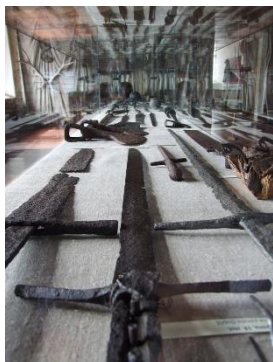
Archeologické exponáty opočenského zámku