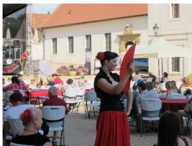
Španělská slavnost na zámku Litomyšl