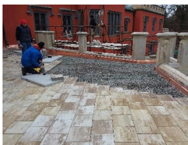
Stavební obnova západní a jižní terasy portiku na Hrádku u Nechanic