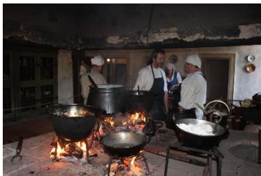
Černá kuchyně na zámku Lemberk

mince. Jedná se o kruhový peníz s uhersko-českým znakem Matyáše Korvína, datace kolem roku 1470, mincovna České Budějovice.