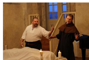
Grabštejn, noční prohlídka „Ze života diplomata“