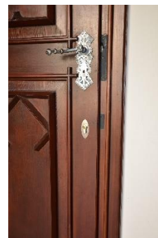
Euroklíč na zámku Sychrov