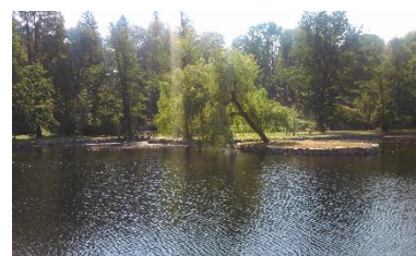
Revitalizace zámeckého rybníku na Frýdlantě