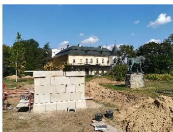
IROP Slatiňany – „Šlechtická škola v přírodě“

Po přivalových deštích v roce 2013 došlo k výraznému zhoršení stavu zámeckého rybníka. Po přidělení dotace z MK ČR byla realizována rekonstrukce opevnění zátopové plochy a přítokového koryta – původní dožilá vrdřeva byla nahrazena kamennou zídkou z místního čediče, došlo k odstranění sedimentů ze dna rybníka, opravě rybniční hráze a stavidla, instalaci nové lávky a zábradlí na hrázi. Součástí akce byly také rozsáhlé vegetační úpravy. V rámci archeologického průzkumu došlo k nálezů tzv. Frýdlantského pokladu – zlaté a stříbrné mince z 16. století a další cenné artefakty.