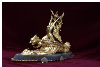
Zlatý poklad na Sychrově