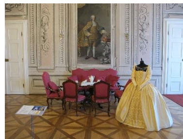
Výstava Krása (v) kostýmu na zámku Litomyšl