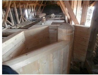
Budování podstřeší Templářského paláce hradu Bezděz