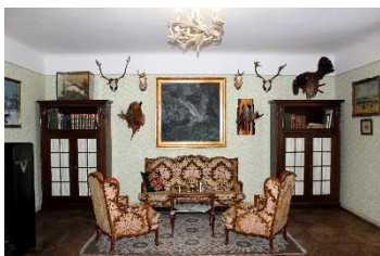
Byt nadlesního na zámku Zákupy