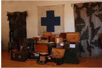
Prohlídkový okruh Veterinární muzeum na Grabštejně