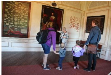
Dětské prohlídky na Frýdlantě