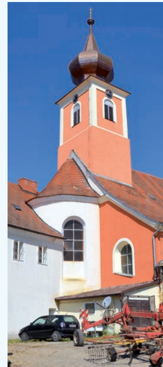
Pohled od jihovýchodu, z hospodářského dvora v sousedství.

G. H. Stadion war Dekan im Kapitel der Kathedrale in Würzburg (Bayern) und eine der führenden Persönlichkeiten des dortigen kirchlichen Fürstentums gegen Ende des 17. Jahrhunderts bis zu seinem Tode im Jahre 1716. Außerdem organisierte und unterstützte er Architektur und bildende Künste. Höchstwahrscheinlich ließ er die Kirche in Trhanov nach dem Muster der zwischen 1657 und 1661 erbauten Heiligkreuzkapelle in Eibelstadt bei Würzburg errichten. Im Grunde genommen, haben beide Gebäude dieselbe Grundriss- und räumliche Disposition und vor allem die gleichen Grundrissdimensionen. Bewerten kann man die Kirche in Trhanov demzufolge als eine bemerkenswerte, wenn auch nur partielle Randerscheinung auf dem Hintergrund der breit verbreiteten historisierenden und retrospektiven architektonischen und künstlerischen Tätigkeit in Mitteleuropa zwischen der zweiten Hälfte des 17. Jahrhunderts und dem ersten Drittel des 18. Jahrhunderts.