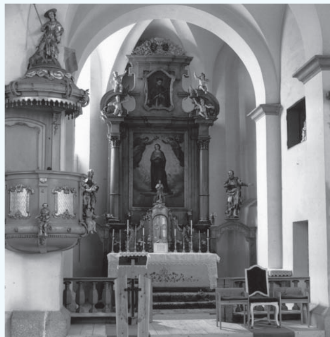
Chór a apsida s hlavním oltářem. (Foto J. Gryc, 1979)

V kostele se dochoval historický mobiliář, zejména tři oltáře, kazatelna a varhany. Pochází ponejvíce z první třetiny 19. století. Některé prvky sochařské a malířské výzdoby jsou však starší, vrcholně barokní. V sakristii visí na stěně velký,