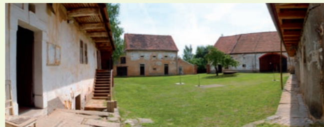
Pohled do dvora od hlavní brány. Zcela vlevo je kamenný vstupní portál do síně v obytném stavení (na nadpraží portálu je vyryt letopočet 1809).

Koncem sedmdesátých let 20. století se v katastru Bolevce začalo s výstavbou velkého panelového sídliště, které padla za oběť značná část staré vesnice. Díky svým jedinečným památkovým hodnotám zůstalo zachováno alespoň jádro kolem návsi, formované středověkým urbanismem. Již tehdy se uplatnily úvahy o využití dvora U Matoušů k jiným než zemědělským účelům (návrh na zřízení stanice mladých přírodovědců nebyl realizován). V devadesátých letech 20. století byl dvůr ve špatném technickém stavu navrácen původním majitelům. Myšlenka na jeho využití