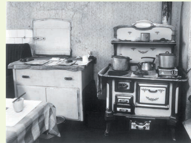
Kuchyně. (Foto z roku 1993)

Na jihozápadní straně dvora stojí podélný zděný objekt chlévů a stáje se sedlovou střechou, která má přesah nad zápražím. Ve zdivu severního štítu je osazen kamenný blok s tesanou klíčovou střílnou, jehož původ je nejasný. Objekt se dispozičně dělí na tři nesterénně velké části samostatně přístupné ze zápraží; dvě větší komory zastropené pásy ploché klenby do válcovaných železných profilů