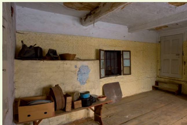
Zadní světnice s pecí.

sloužily k ustájení koní a skotu, jak naznačují plastiky hlav těchto hospodářských zvířat umístěné nad vchody. Objekt byl postaven nejpozději v 1. polovině 19. století (stavební dřevo na hambalkový krov se stojatou stolicí je datováno před rok 1833) a v následujících desetiletích byl opakovaně modernizován, naposled právě tehdy, kdy v něm vznikly výše zmíněné ploché klenby.