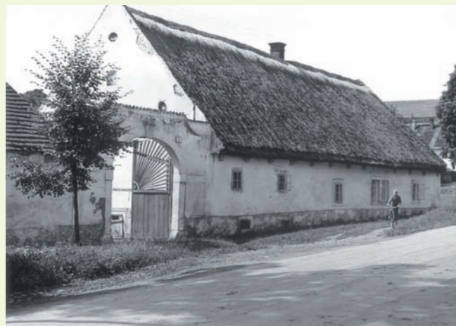
Pohled od severovýchodu na obytné stavení ještě se slaměnou (doškovou) střechou a na zadní bránu z roku 1830. (Stav v roce 1970)