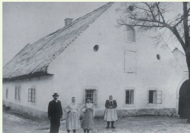
Hlavní průčelí obytného stavení směrem do návsi kolem roku 1900.

Selský dvůr (statek) čp. 1 U Matoušů v Plzni-Bolevcích se nachází na území městského obvodu Plzeň 1. Je součástí památkové zóny s pozůstatky poměrně velké návsi trojúhelníkového tvaru a přilehlé zástavby staré vesnice Bolevec, jež se v písemných pramenech připomíná poprvé k roku 1382. Představuje velmi hodnotný soubor