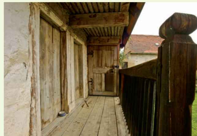
Pavláčka vzadu na nádvoří straně obytného stavení.

Obytná část je v předním dílu dvoutraktová (světnice a světnička). Střední díl se dále dispozičně člení na vstupní síň a někdejší, v minulosti ovšem již zmodernizovanou černou kuchyni včetně pece. Z kuchyně vede podél severní obvodové zdi domu chodbička do malé komory zřízené v zadním dílu, jenž zahrnuje další velkou (zadní) světnici s okny do dvora. Z této světnice lze vstoupit do zadní třetiny celého objektu, sloužící kdysi převážně hospodářským účelům a uspořádané, jak již bylo výše zmíněno, do dvou úrovní: nahoře jsou celkem čtyři komory a v přízemí malé chlévy sklenuté šesticí takzvaných placek do pasů na dva střední pilíře.