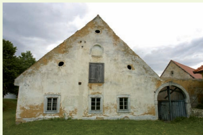
Hlavní průčelí obytného stavení.

Der Bauernhof Zu Matoušs (Konskr.-Nr. 1) befindet sich im südöstlichen Teil des Dorfplatzes innerhalb einer ursprünglich mittelalterlichen Gemeinde, die gegenwärtig ein Bestandteil der Stadt