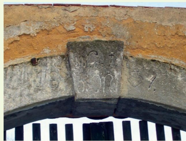
Kamenný klenák oblouku přední brány s vyrytým letopočtem 1834, číslem (numerem – N. o.) I a iniciálami S. M.

Pilsen ist. Im Vordergrund steht ein geräumiges Wohngebäude aus dem Jahre 1809, an das zwei gewölbte gemauerte Tore unmittelbar anknüpfen, eine in Richtung Westen (1834) und die andere in Richtung Norden (1830). Die südwestliche Seite des Bauerngutes vermarken Vieh- und Pferdeställe aus dem ersten Drittel des 19. Jahrhunderts. Im Süden gibt es eine geräumige Scheune (spätestens aus den 30er Jahren des 19. Jahrhunderts) mit einem ehemaligen Schuppen. Neben der Ostseite des Bauernhofes blieb ein Kornspeicher erhalten, wahrscheinlich aus den 30er oder 40er Jahren des 19. Jahrhunderts. In dem Raum zwischen dem Wohngebäude und dem Kornspeicher gibt es einen anderen hölzernen Schuppen (Wagenschuppen). Das Gehöft umfasst auch einen eher kleinen Garten und einen Obstgarten. Der Bauernhof Zu Matoušs in Pilsen-Bolevec stellt einen einzigartigen Nachweis der städtebaulichen Einordnung, Architektur und des Bauwesens in der dörflichen Umgebung Pilsens in der Vergangenheit dar. Seitens der Staatsbehörden ist die Anlage als ein Nationalkulturdenkmal geschützt. Seit 2007 wird sie von dem Nationalinstitut für Denkmalpflege verwaltet. Nach der Fertigstellung der denkmalgerechten Wiederherstellung wird sie der Öffentlichkeit zugänglich sein und für Bildungs- und kulturelle Zwecke dienen.