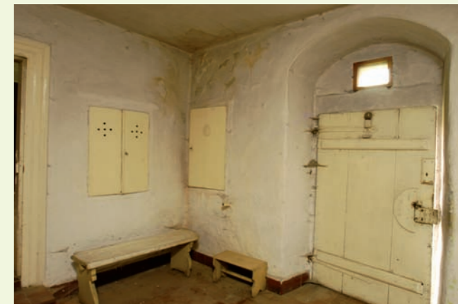
Síň v obytném stavení. Vpravo je nika vstupního portálu.

Všechny obytné místnosti i komory mají ploché trámové stropy s povalem z kulatiny, zakryté hliněnou omítkou. Obvodové zdivo je kamenné (z pískovcových bloků) nebo z cihel s výjimkou nádvoří strany přední světnice, která je roubená (dendrochronologický průzkum tohoto srubu klade jeho vznik do druhé poloviny 18. století). Okna v obytné části jsou dvoukřídlá, ve světnici a světničce před-