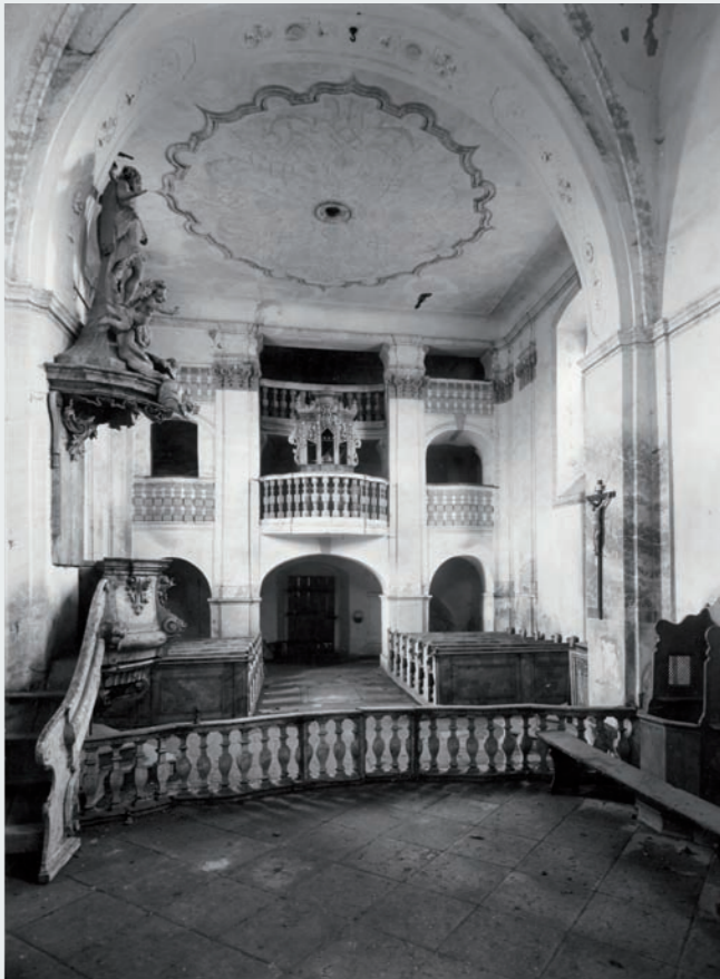
Pohled z presbyteria do lodi na západní hudební kruchtu. (Foto z r. 1951)

Poslední významné stavební změny kostela v Horšově, nově vysvěceného v roce 1745, jsou vrcholně barokní z doby kolem roku 1740. Navenek se uplatňují jenom dílčím způsobem jako například dvěma kasulovými okny, jimiž je osvětlen prostor lodi,