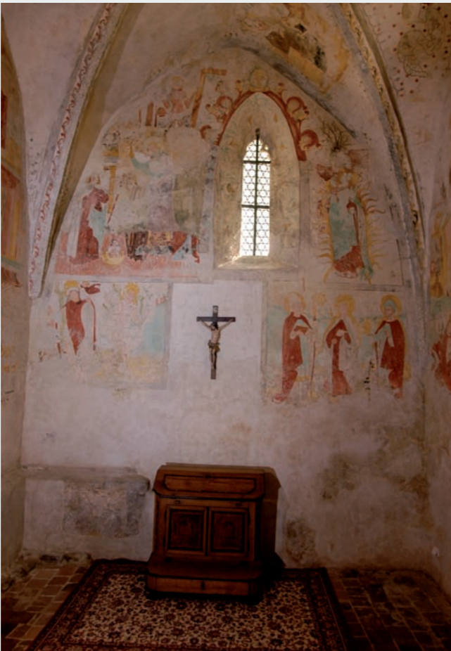
Pohled na východní stěnu sakristie s gotickými malbami různého stáří. Vlevo od okna je vyobrazen archanděl Michael, jak váží duše (tzv. Psychostasis); jde o vyjádření biblické myšlenky o posmrtném odměňování dobrých a naopak trestání zlých lidských skutků při Posledním soudu (miska vah s hříšníkem obtěžkaná jeho zásluhami klesá dolů navzdory snahám dábla na druhé straně tento výsledek zvrátit; část malby s ďáblem už není dobře čitelná). (Foto z r. 2005)

mistra jsou i půdorysně zprohýbané balustrády v prvním patře a ve středním poli druhého patra hudební kruchty nebo bohatá štuková výzdoba na spodní ploše barokně upraveného triumfálního oblouku a na ostění oken v lodi i presbyteriu.