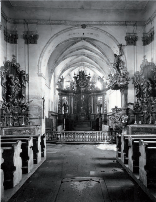
Pohled z lodi do presbyteria. (Foto z r. 1951)

Téměř v celém rozsahu dosud existuje jižní a západní obvodová zeď někdejší chrámové lodi o světlé šířce 5,2 m a celkové délce odhadem 12 m, včetně západní štítové zdi její sedlové střechy a půlkruhové sklenutého, nejpozději v době barokní zazděného okna, jež osvětlovalo loď od jihu. Výška jižního průčelí románské lodi činila zhruba 7,7 m. Hranolový pilíř volně stojící v jihozápadním koutu lodi dnešního kostela, dva půlkruhové klenební pasy vybíhající z tohoto pilíře v příčném a podélném směru a jimi v poloze pod koutovou věží vynesená bezžeborná křížová klenba s čelnými oblouky opět půlkruhového tvaru, s mírně stoupajícími vrcholnicemi a konkávní, jakoby rotační plochou ve vrcholu, to vše tvořilo kdysi součást zděné konstrukce románské tribuny.