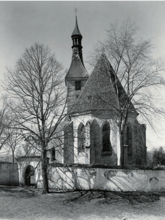
Pohled od východu. (Foto z r. 1951)

Románský kostel v Horšově vznikl přibližně v 2. polovině 12. nebo na počátku 13. století jako podélná jednolodní svatyně, opatřená nejspíš apsidou, popřípadě pravouhlym závěrem na východní straně. Na takové půdorysné a prostorové uspořádání stavby poukazují poměrně rozsáhlé pozůstatky jejího vsílého zdiva provedeného z velkých žulových kvádrů o délce až 1,2 m a výšce běžně 0,3–0,5 m.