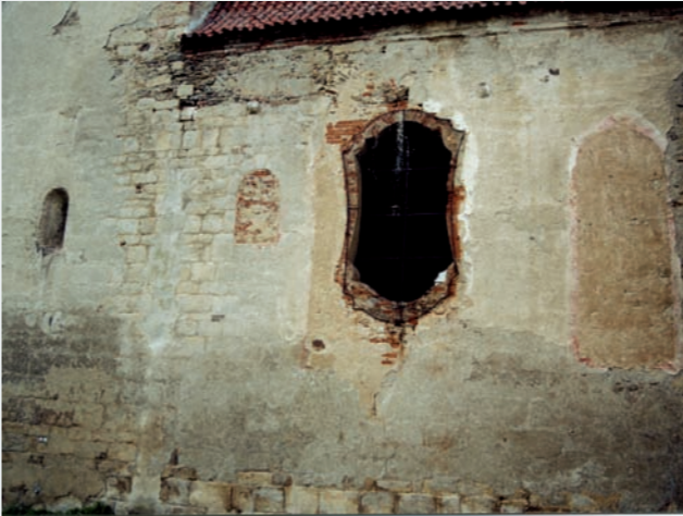
Pohled na část jižního průčelí lodi před obnovou fasád. Je dobře patrné například umístění barokního kasulového okna na místě vysokého gotického okna, zazděné románské okno (vlevo) a zazděné gotické okno (zcela vpravo), románské kvádrové zdivo, románské okno v patře pod koutovou věží (na tribunu; zcela vlevo) a torza dvou konzol v úrovni okapu průčelí zaniklé románské svatyně. (Foto z r. 2001)

Gotická přestavba kostela proběhla v době kolem roku 1363. Zatímco pětiboce ukončené presbyterium tehdy vzniklo jako nové dílo s uslechtilými proporcemi vnitřního prostoru, při stavbě lodi o rozponu 9,8 m gotický mistr využil co nejvíce zdiva románské svatyně, pokud mělo po stránce ušnosnosti jeho důvěru a nepřekáželo mu v záměru tuto svatyni rozšířit na severní stranu, zvýšit ji a podstatně prodloužit. Hospodárné zacházení se současně týkalo nejen dávno předtím vykonané zednické práce, ale i stavebního materiálu. Svědčí o tom zejména severní obvodové zdivo lodi a přilehlá část její západní zdi v rozsahu rozšíření lodi románského kostela, kde jsou skryty pod omítkami velké souvislé plochy rádkového zdiva provedené z druhotně použitých žulových kvádrů.