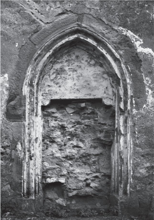
Bývalý (gotický) vstupní portál na severní straně lodi kostela. (Foto z r. 1958)

V severním průčelí lodi se nalézá gotický portál, zčásti zazděný v barokním období a kdysi chráněný ještě gotickou, nebo renesanční vstupní předsíní se sedlovou střechou. Společně s protáhlymi, dvojitě vyžlabenými žebry klínového průřezu a dvěma římsovými konzolami klenby v presbyteriu dnes nejlépe vyjadřuje uměleckou úroveň a způsob zpracování článků architektury příznačných pro gotickou přestavbu kostela, jež se dochovaly pouze v omezeném