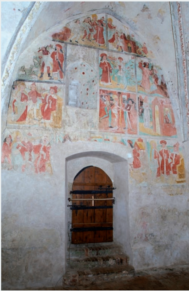
Pohled na západní stěnu sakristie s pozdně gotickými malbami o sv. Barboře z doby kolem roku 1489. (Foto z r. 2005)

Aby se dosáhlo dojmu souměrnosti u vestavby hudební kruchty, byla kruchta uspořádána nad trojčetným půdorysem v přízemí, přičemž její severní obdélné pole s plochým stropem má stejnou šířku jako protilehlé pole jižní, tvořené zděnými konstrukcemi tribuny románské svatyně. V prvním i druhém patře dnešní kruchty se trojčetnost v prostorovém řešení již neopakuje. Barokní mistr však navodil zdání opaku a kruchtu pro pohled od hlavního oltáře rozdělil souměrně podle svislé osy do třech polí párem svazkových pilastrů vytvořených ve vysokém řádu. Témuz záměru podřídil další architektonické členění, když starý průhled z klenuté místnosti pod koutovou věží (původně jižní část románské tribuny) nechal směrem do lodi upravit a opatřit slepým segmentovým obloukem, jenž je proveden mezi sousedními pilastry a podobá se stlačenému oblouku nad průhledem umístěným na opačné (severní) straně prvního patra kruchty. Projevem umění obratného barokního