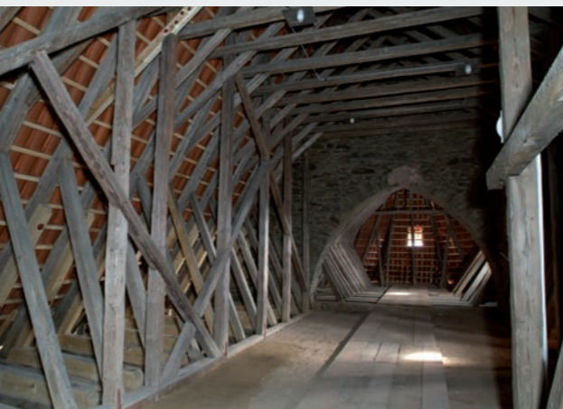
Krov nad lodí s průhledem do krovu nad presbyteriem. Oba krovny, pocházející z doby kolem roku 1363, odděluje navzájem štítová zeď s původním vynásecím klenebním pasem. (Foto z r. 2006)

Vnitřní vybavení kostela barokním mobiliářem, jehož ucelené části byly pořízovány postupně v období let 1740 až 1779 – hlavní oltář byl vysvěcen v roce 1745, boční oltář Panny Marie v roce 1747 a boční oltář sv. Anny v roce 1773(?); v roce 1779 byly pořízeny varhany, zatímco kazatelna pochází snad již z roku 1740 – působí společně s dobovými úpravami stavby v jednotném, slavnostním účinku vrcholně barokního chrámového interiéru. Zejména monumentální hlavní oltář s retabulem na způsob sloupové architektury s postranními portály, oba boční oltáře baldachýnového typu a kazatelna se vyznačují velkou výpravností sochařské a dekorativní řezbářské práce.