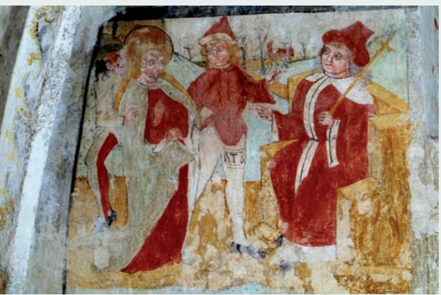
Detail nástěnné malby v sakristii – scéna Předvedení sv. Barbory před vladařem Marciana. (Foto z r. 2005)

Die Allerheiligenkirche in Horšov ist ein unter staatlichem Schutz stehendes Kulturdenkmal. Ihr gegenwärtiges Aussehen ist das Ergebnis von mehreren Bautappen, bei denen die Elemente der romanischen, gotischen und barocken Architektur zum Vorschein kamen. Das aus Granitquadern ausgemauerte romanische Heiligtum, das mit der Westtribüne versehen wurde, entstand irgendwann in der zweiten Hälfte des 12. Jahrhunderts oder am Anfang des 13. Jahrhunderts. Im gotischen Stil wurde die Kirche in der Zeit um 1363 umgebaut. Aus jener Zeit blieben die Dachstühle über dem Kirchenschiff und dem Presbyterium erhalten. Sowohl die bauliche Instandsetzung im Jahre 1740 als auch die etwas jüngere Barockausstattung des Innenraums gaben dem Denkmal sein gegenwärtiges Aussehen. In der Sakristei der Kirche sind bemerkenswerte spätgotische Wandmalereien zu sehen, die unter anderem die Legende über die heilige Barbara in 25 Bildern darstellen. Zwischen 2001 und 2005 machte die Kirche in Horšov eine umfangreiche denkmalgerechte Wiederherstellung durch. Seit 2005 ist die Kirche für die Öffentlichkeit zugänglich und bietet Kulturprogramme an.