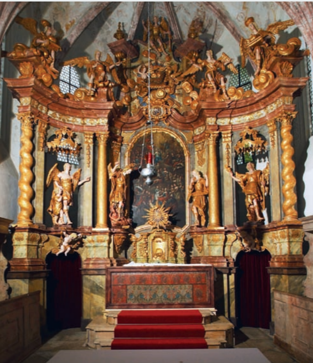
Hlavní oltář z roku 1745. (Foto z r. 2005)

Náklady na celkovou památkovou obnovu kostela v Horšově v období let 2001–2005 neslo Ministerstvo kultury společně s Národním památkovým ústavem v rámci programů záchrany architektonického dědictví a restaurování movitých kulturních památek. Od roku 2005 je kostel zpřístupněn pro veřejnost. Konají se v něm prohlídky s odborným výkladem, přičemž je možné zavítat i na půdu s unikátními gotickými krovny. Příležitostně památka slouží opět bohoslužbám, pro svatby a také jako místo pro pořádání svátečních koncertů a výstav.