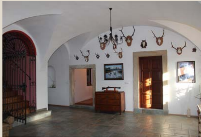
Obnověná vstupní síň v přízemí „zámečku“.

pro což svědčí mimo jiné i nález zbytků velkého osvětlovacího krbečku. Hospodářská část budovy vpravo od vstupní síně má trojtraktové uspořádání. Středem dispozice vede chodbička s křížovými klenbami, sloužící původně jako přímá komunikace s přízemím sýpky. Za vstupem ze síně ústí přímé schodiště do sklepa. Sklep tvoří trojice nízkých, valeně klenutých místností.