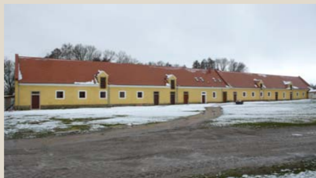
Budova chlévů a stájí po obnově, pohled od severu.

The sprawling farmyard called Gigant (land registry number 1) dominates the village of Záluží near Kotovice, about 18 km to the southwest of Pilsen. Originally a manorial farm belonging to the Premonstratensian convent of Chotěšov, it is shaped as an irregular rectangle, enclosed from all sides by agricultural, residential and administrative buildings. Because of its extraordinary values it was designated as a cultural monument in 1958.