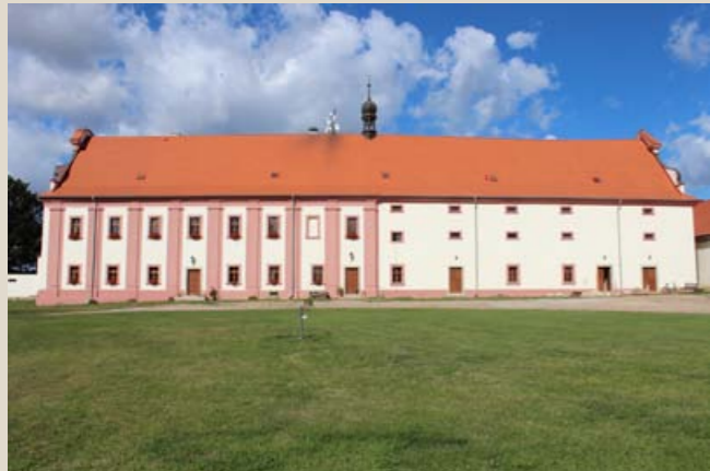
Východní strana obytné budovy se sýpkou po dokončení obnovy fasád, pohled ze dvora od východu. (Foto K. Foud, 2020)

Archeologický objev pravěkého zahloubeného objektu v hlavní budově statku a plošné nálezy středověké keramiky dokládají dlouhodobé osídlení lokality. Ves je poprvé zmiňována v roce 1272 jako součást majetku nedalekého chotěšovského kláštera premonstrátů. Hlavní složku jeho příjmu tvořily vedle poddanských dávek právě výnosy z hospodářských dvorů. Po třicetileté válce došlo k výraznému stavebnímu rozvoji kláštera, kdy byly kromě vlastního sídla v Chotěšově upravovány i dvory.