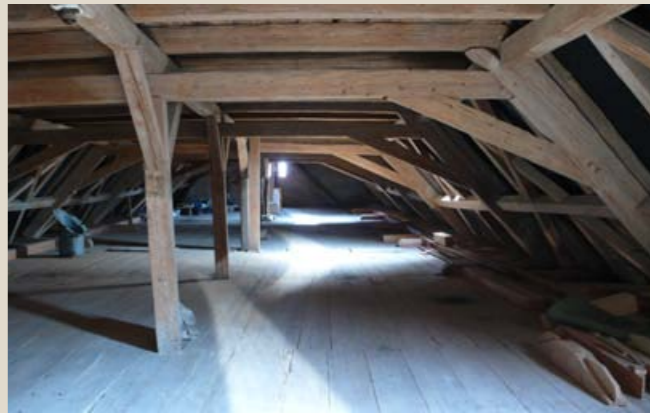
Opravená barokní krovová konstrukce budovy „zámečku“.

První patro obytné budovy má reprezentativní charakter a sloužilo jak k pobytu klášterních správců, tak i hostů. Vstupní schodiště ústí do haly s navazující komunikační chodbou. V celém rozsahu jsou zde zachovány barokní trémové omítané stropy s fabionem. Odstraněním druhotně vložených příček se podařilo rehabilitovat původní dispozici. Místnosti jsou přístupné vysokými dvoukřídlými dveřmi, nad nimiž byly objeveny pozůstatky malovaných latinských nápisů (zřejmě vázaných na účel jednotlivých místností), a jejich stěny člení dekorativní výmalba. Strop imponantního sálu v nároží zdobí štukové zrcadlo s latinským nápisem. Dochovala se i menší černá kuchyně s dymníkovou klenbou nesenou trémovým překladem – mandrholcem. Pravou trojtraktovou část tvořily za sebou řazené místnosti, vytápěné kachlovými kamny obsluhovanými z chodby. V objektu bývala i kaple, doložená popisem vybavení k roku 1782.