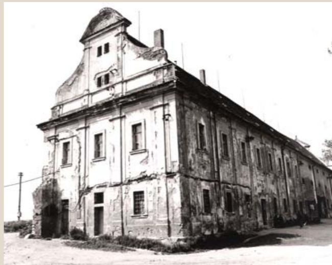
„Zámeček“ od jihovýchodu v době hospodaření státních statků.

Mohutná barokní stavba má poměrně unikátní koncepci spojující obytnou, reprezentativní i hospodářskou funkci a dominuje areálu dvora. Průčelí obytné části, zvané pro svou výstavnost zámeček, je členěno vysokými pilastrami, lemovanými lizénovými rámy a nesoucími bohatě profilovanou hlavní římsu. Ostění vstupů i oken jsou kamenná. Stít je trojdílný, rozdělený svazkovými pilastrami a završený vlnovitě zakřiveným nástavcem. V jeho horní