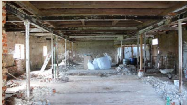
Interiér bývalých chlévů (dnes dílna) v průběhu rekonstrukce.

Po restituci majetku na počátku devadesátých let 20. století byla rodinou Korců zahájena rozsáhlá záchrana a obnova hospodářského dvora. Likvidovaly se vraky zemědělské techniky a vyvážely desítky tun odpadu. Alespoň provizorně se opravovaly střechy. Z interiéru chlévů byly vybourány novodobé betonové podlahy, v sýpce se zazdívaly druhotně proražené vjezdy pro traktory, rehabilitovaly se původní vstupy i okenní otvory, probíhalo odvlhčení a opravy zdiva. Postupně byly obnoveny fasády, dveře, okna a střechy, opraveny krovy a interiéry. Rovněž došlo na rekonstrukci zaniklé zvonice ve střeše hlavní budovy. V jejím klenutém přízemí vznikl reprezentativní prostor pro konání výstav a dalších kulturních akcí. Chlévy a stáje jsou dnes víceúčelovými prostory. Majitelé Gigantu však nezapomínají ani na obnovu krajiny, kde se jim podařilo revitalizovat nejen blízké okolí, ale také Dvorský rybník ležící asi 500 m západně od areálu.