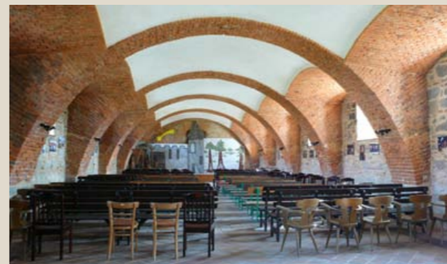
Společenský sál vznikl v bývalých chlévech a stájích. (Foto K. Foud, 2012)

farmyard was acquired by Jan Kotiš and afterward by the Zima family. In compliance with the Munich Agreement the estate with the farm fell to the Greater German Reich in October 1938. After the war, the farmyard was returned to the original owners, but February 1948 brought about its nationalisation. Within the restitution procedure in the 1990s, the current owners (the Korec family) recovered the farmyard in a dilapidated condition. Since then, the gradual rehabilitation of the site has still been in full progress. The structures were given new roofs, facades and utilisation. Repairs to the buildings were supported from grant programs, e. g. by the Czech Ministry of Culture. Thanks to the approach shown by the current owners, the farmyard now ranks among the prominent sites of its kind not only in the area around Pilsen. It is still utilised for agricultural activities, besides being presented during various social events to the general public as a monument of Baroque and Neoclassical architecture.