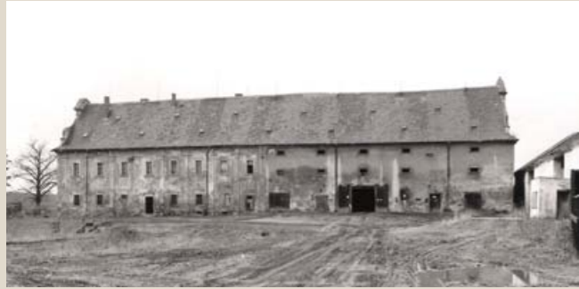
„Zámeček“ se sýpkou v době užívání státními statky, pohled ze dvora od východu. (Foto J. Gryc, 1988)

Hospodářský dvůr čp. 1, dnes zvaný pro svou rozlohu Gigant , tvoří dominantu vsi Záluží u Kotovic (okres Plzeň-jih), která leží asi 18 km jihozápadně od Plzně. Původem klášterní vrchnostenský dvůr zaujímá půdorys nepravidelného obdélníku, uzavřeného ze všech stran hospodářskými a správními objekty. Pro své mimořádné hodnoty byl areál v roce 1958 zapsán do seznamu kulturních památek.