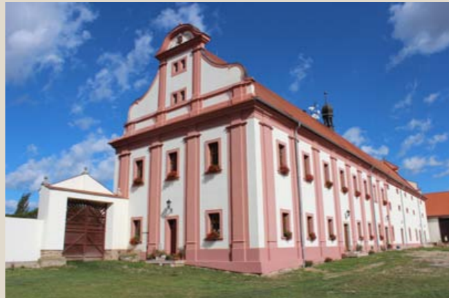
Jihovýchodní nároží obnověného „zámečku“.

ploše je obnoven plastický znak chotěšovského kláštera, lemovaný latinským nápisem „ORA PRO NOBIS DEO“ („Modli se za nás k Bohu“). Střed dispozice tvoří vstupní síň, zaklenutá valenou klenbou se třemi páry trojúhelných výsečí. Vlevo proti vstupu se nachází klenutá kuchyně, přístupná kamenným portálkem