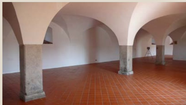
Obnovený interiér klenutého přízemí sýpky, kde vznikl výstavní prostor.

Finančně náročná obnova někdejšího klášterního dvora v Záluží u Kotovic byla po etapách podpořena dotačními programy Ministerstva kultury (Havarijní program, Program zachrany architektonického dědictví atd.) a dalšími stranami, např. Plzeňským krajem. Na rozdíl od jiných obdobných historických areálů zálužský dvůr přežil a díky péči současných držitelů dnes patří k předním památkám svého druhu v celém Plzeňském kraji. Snaha vlastníků o záchranu a zachování dvora byla v roce 2020 dekorována cenou ministra zemědělství České republiky „Patria Nostra“ za péči o rozvoj českého venkova.