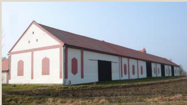
Stodola, pohled od severovýchodu.

K bočnímu průčelí obytné budovy přiléhá obnovená klenutá barokní brána se štítovým nástavcem. Barokní stavební etapa je zachována také v obvodových zdech stodoly na severní straně dvora, s dochovanou fasádou výzdobou tvořenou omítkovými zrcadly. Krov stodoly pochází až z doby přestavby v 19. století.