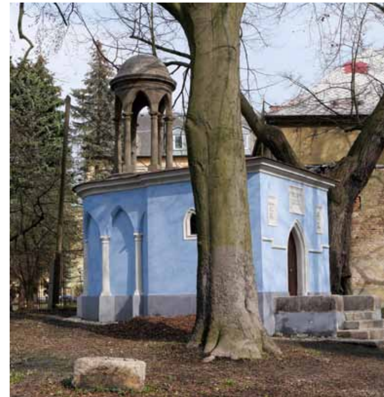
Gesamtansicht der Heilig-Grab-Kapelle von Nordwesten.