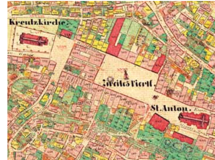
Stadtzentrum auf einem Kartenausschnitt des Franziszeischen Katasters (1843), der die Heilig-Grab-Kapelle sowie die benachbarte Mariensäule an ihren ursprünglichen Standorten zeigt.