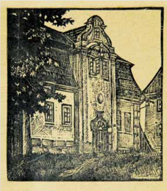
Grafische Darstellung aus der ersten Hälfte des 20. Jahrhunderts mit den charakteristischen Linien des gewellten Giebels und Mansarddachs.

Das Haus U Pelikána in der Straße Na Perštýně ist ein typisches Beispiel für die klassizistische Liberecer Architektur. Es entstand in einer Zeit, für die der Aufschwung der Textilherstellung sowie die wirtschaftliche Blüte charakteristisch waren, in einer Zeit, zu der die Mauerwerk-Architektur allmählich die ursprüngliche hölzerne Bebauung ersetzte und somit die bisherige Gestalt der Stadt für immer veränderte. Zu Beginn des 18. Jahrhunderts zählte Liberec etwa 370 Häuser, überwiegend Holzhäuser. In der zweiten Hälfte desselben Jahrhunderts entfaltete sich mit allmählich zunehmendem Kapital und der Unterstützung derer von Clam-Gallas die Bautätigkeit, die dann gegen Ende des 18. und Anfang des 19. Jahrhunderts ihren wirklichen Höhepunkt erreichte. Im gegebenen Zeitraum entstanden bedeutende städtebauliche Komplexe, wie Filipovo Město (Philippstadt) oder Kristiánov (Christianstadt), die zu einem Vorbild der weiteren Entwicklung wurden und deren grundlegende Bauprinzipien und Stilcharakter sich in vielerlei Hinsicht auch in der Gestaltung des Hauses U Pelikána widerspiegeln.