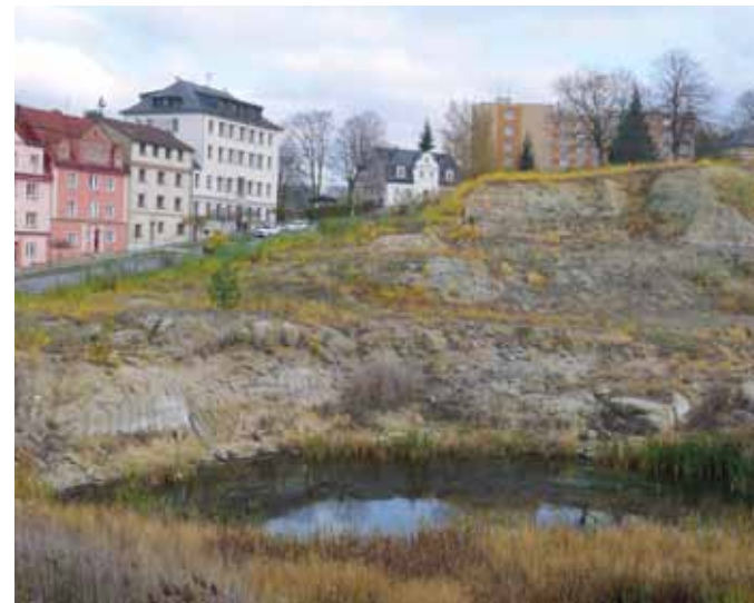
Gesamtanblick der Straße Na Perštýně, auf dem die weiteren urbanistischen Zusammenhänge sowie der gegenwärtige unerfreuliche Zustand zu erkennen sind.