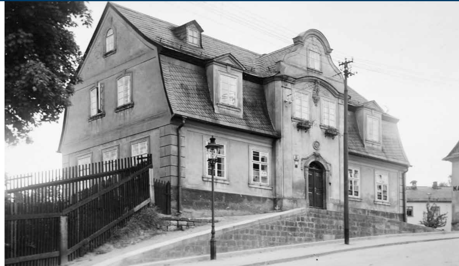
Historisches Foto von Anfang der 30er Jahre des 20. Jahrhunderts, auf dem das ursprüngliche Schieferdach zu erkennen ist.

Hinsichtlich der dekorativen Lösung ist der Bau relativ nüchtern. Die Eingangsfassade ist zwar von repräsentativem Charakter, wenn wir jedoch den eher kleineren Maßstab des Hauses betrachten und ihn mit den ansehnlichen klassizistischen Stadthäusern der Händler vergleichen, die auf den Liberecer Plätzen errichtet wurden, handelt es sich wirklich um eine bescheidenere, trotz allem jedoch dekorative