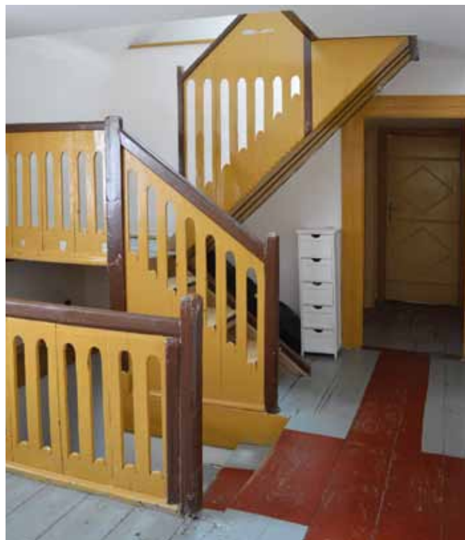
Interieur des ersten Geschosses mit Holzterasse und Geländer.