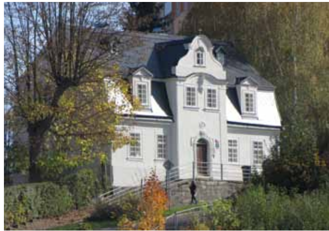
Derzeitige Gestalt des Hauses nach der letzten umfangreichen Sanierung, die im Jahr 2017 stattfand.

1923 neu eingemeißelt wurde. Über dem Keilstein schließt ein teilweise gemeißeltes und mit Stuck ergänztes Feston mit floralem Motiv an. Zu den typischen Elementen klassizistischer Liberecer Häuser gehörten auch in Stuck oder Stein eingebrachte Hauszeichen. Übrigens erhielt das Haus in der Straße Na Perštýně seinen Namen U Pelikána (Beim Pelikan) auch nach seinem Zierrelief. Ein auf einer vorstehenden Konsole zwischen den Fenstern des Risalits im Obergeschoss unter dem Gesims sitzender Pelikan hat weit ausgebreitete Flügel, unter denen er seine Jungen schützt. Mit dem Schnabel am Ende seines gebogenen Halses rupft er an seiner Brust, um seine Jungen mit seinem eigenen Blut zu füttern. Der westlichen Ikonographie zufolge symbolisiert er das Opfer Christi sowie das Blutvergießen am Kreuz und ist eine Personifizierung der christlichen Liebe. In der älteren, antiken Ikonographie, aus welcher die klassizistische Kunst in vielerlei Hinsicht schöpfte, war der Pelikan das Symbol der Ergebenheit gegenüber den Eltern und der dankbaren Liebe.