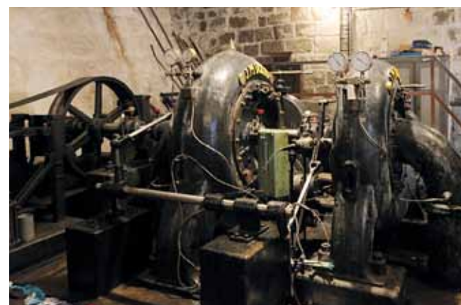
Maschinenanlage MVE II mit Francis-Turbine

und Haupttransformator 5/10kV, elektrischer Teil der Störautomatik). Es erfolgten ebenfalls teilweise bauliche Änderungen, wie z. B. der Austausch des Dachbelags gegen Aluminiumschablonen. 1996 ging das Kraftwerk in das Eigentum von Povodí Labe über und seinen Betrieb gewährleistet seitdem das Werk Jablonec nad Nisou, Betriebszentrum Liberec. 2001 wurde das MVE Bedřichov, Rudolfovo I und II mit einem Monitoringsystem zur automatischen Überwachung der meteorologischen, hydrologischen und betrieblichen Größen ausgestattet. In den Jahren 2012–2013 erfuhr die Hochdruck-Maschineneinheit MVE I eine Generalüberholung, bei welcher