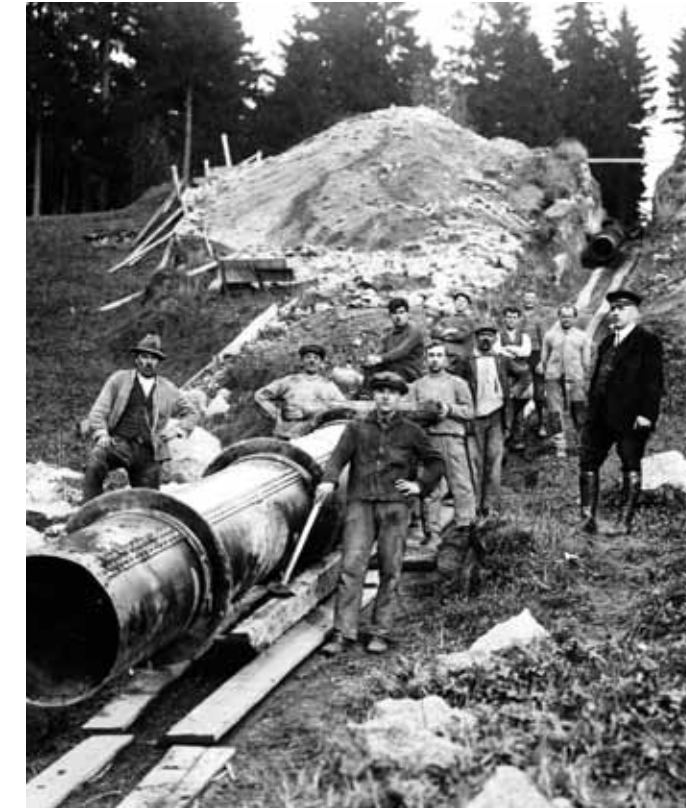
Verlegen der Druckrohrleitung, 1926