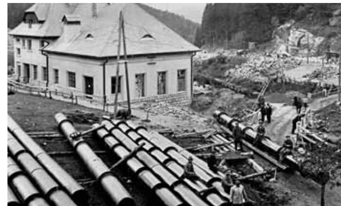
Zur Montage vorbereitete genietete Flansch-Druckrohrleitung. Links das Kraftwerk Rudolfovo I, rechts der Raum für das künftige Ausgleichsbecken, ganz rechts Teil des für den Bedarf des Baus geöffneten Steinbruchs, 1926

drei Kilometer lange Zubringer führt durch waldiges Gebiet. Gebildet wird er von einem abgedeckten Kanal mit U-Profil aus einfachem Beton (an der Stelle der zwei Aquädukte aus Eisenbeton), der 1 m breit und in der Mitte 1,23 m hoch ist. Neben dem eigentlichen Kanal, der von oben mit Betonplatten abgedeckt und mit Erdreich bedeckt ist, war es notwendig, zwei Becken zur Zurückhaltung des Geschiebes aus den linksseitigen Zuflüssen des Zubringers zu bauen – an diesen Stellen wird er durch kurze Aquädukte geführt. Der druckfreie Teil des Zubringers endet im Wasserschloss mit Ausgleichskammer, Entschlammungsschleuse, Sicherheitsüberlauf und Feinrechen. Von hier aus führt die Druckrohrleitung zum Kraftwerk hin, zunächst oberirdisch auf Betonpfeilern, im Abschnitt über dem Kraftwerk dann unterirdisch. Die genietete Stahlrohrleitung mit einem Durchmesser von