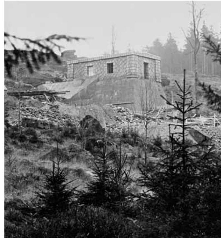
Wasserschloss vor der Fertigstellung, 1926–27

Fledermausgauben war ursprünglich mit gebrannten Biberschwanz-Dachtaschen gedeckt, heute mit Bitumenschindeln. Im Ausgleichsbecken am Kraftwerk mischen sich das Wasser aus dem Abwasserkanal von der Turbinen und das Wasser der Schwarzen Neiße. Das Wasser im Becken wird von einer aus Granitquadern gemauerten Gewölbegewichtsstaumauer mit einer Länge von 63 m und einer Höhe von 14,6 m in der Krone zurückgehalten. Die Staumauer ist am Fundament 12,6 m und an der Deichkrone 2,9 m breit. Neben dem Grundablass mit einem Durchmesser von 0,8 m gewährleistet ein Sicherheitsüberlauf mit einer Breite von 12 m mit anschließender Kaskade die Umleitung des Wassers. Dieser ist mit einer automatischen Stauklappe mit Betongegengewicht gedämmt. Das Volumen des Beckens beträgt 25 100 \text{ m}^3 .