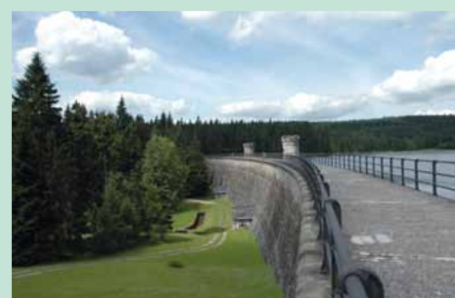
Damm der Talsperre Bedřichov an der Schwarzen Neiß