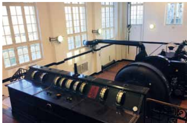
Maschinenanlage MVE I mit Pelton-Turbine

Die abschließende Kollaudation des Wasserbauwerks fand am 18. und 19. Juni 1929 statt. Im ersten Jahr lief das MVE I im Halbspitzenbetrieb. Dennoch lieferte es volle 1 709 687 kWh ins Netz. Zum Vergleich, das EÜW-Kohlekraftwerk in Andělská Hora produzierte 27 813 283 kWh. Auch in den folgenden Jahren bewegte sich die Produktion um den Wert 1,5 Millionen kWh. Nach dem Zweiten Weltkrieg kam es zum mehrfachen Wechsel des Betreibers. In den Jahren 1961–1996 gehörte das Kraftwerk dem Unternehmen Severočeská energetika Děčín. 1972 kam es zum Austausch einiger Elemente des elektrischen Teils (Schaltanlage