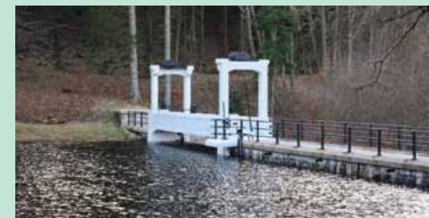
Damm des Ausgleichsbeckens mit automatischer Stauklappe

Herausgegeben vom Nationalinstitut für Denkmalpflege, Zweigstelle Liberec, in Zusammenarbeit mit der Region Liberec im Rahmen des Projekts Präsentation von Denkmälern und in Zusammenarbeit mit dem staatlichen Unternehmen Povodí Labe.