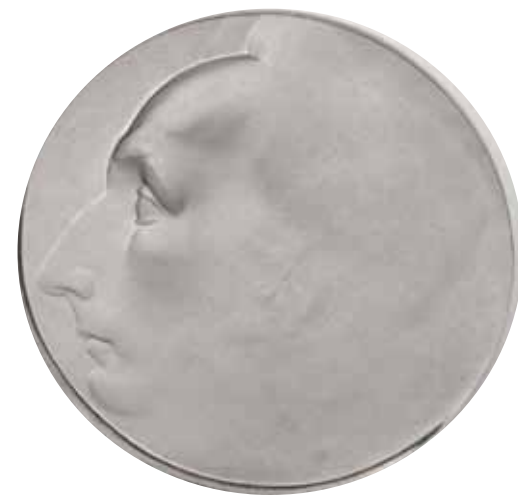
Bohuslav Martinů kruhová portrétní plaketa, bezbarvé čiré sklo, broušené, ryté, 1980