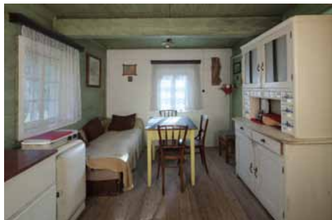
Interiér kuchyně v přízemí

Na konci 70. let 20. století začal Jiří Harcuba s opravami svého domu, včetně objektu někdejší leptárny vystavěné v roce 1925. Opravy však nikdy významně nezasáhly do původní podoby domu, který Jiří Harcuba pietně uchovával ve stejném stavu, v jakém jej obývali jeho prarodiče.