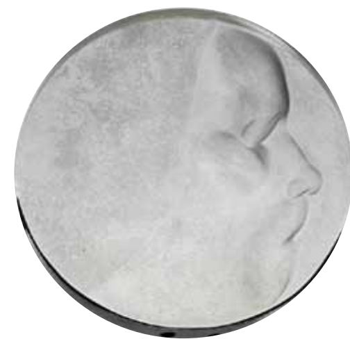
Jan Zrzavý kruhová portrétní plaketa, bezbarvé čiré sklo, broušené, ryté, 1980–1985

Vytvořil množství pamětních medailí a československého oběživa, dodnes je v platebním oběhu pětikoruna (od roku 1993) ražená podle jeho návrhu. Využíval také grafickou techniku vitrografie – černobílého nebo barevného tisku z ryté skleněné desky.