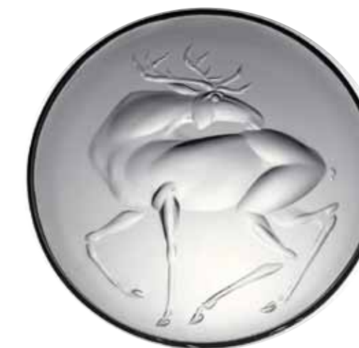
Reliéfní figura losa talíř, bezbarvé čiré sklo, broušené, ryté, 1959, talíř pochází z výstavy čs. skla v Moskvě v r. 1959