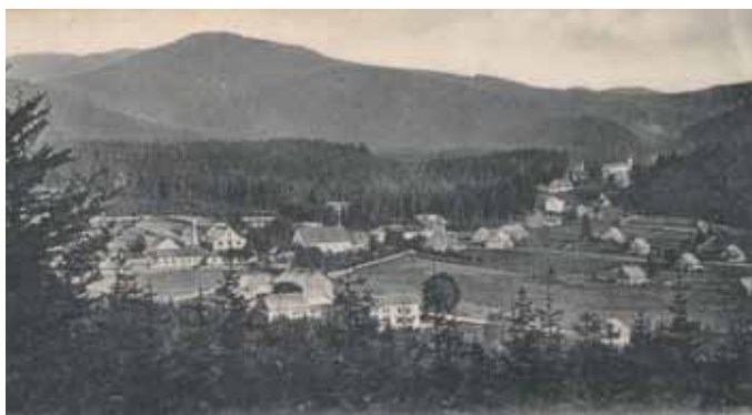
Osada Nový Svět na pohlednici z roku 1899

V roce 2016 získalo Severočeské muzeum v Liberci do správy dům rodiny Harcubových čp. 73 v Harrachově. Objekt vznikl na konci 18. století a jeho poslední obyvateli byli předkové Jiřího Harcuby (1928–2013), významného českého sklářského výtvarníka a harrachovského rodáka. V domě se nachází historicky vzácná domácí brusičská a rytecká dílna, tvořící jedinečně dochovaný soubor sklářských technologií. Díky ní byl dům v roce 1980 zapsán do Ústředního seznamu kulturních památek. Muzeum nyní rozvíjí nově vzniklou muzejní podsídku „Památník Jiřího Harcuby“ a v součinnosti s Libereckým krajem pracuje na koncepci budoucího kulturního využití objektu a jeho bezprostředního okolí.