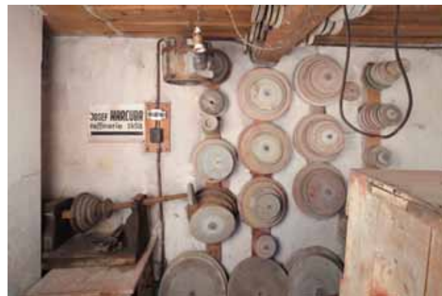
Zařízení brusičské dílny