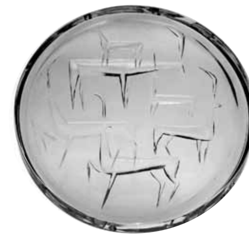
Reliéfní figury jelenů talíř, bezbarvé čiré sklo, broušené, ryté, 1959, talíř pochází z výstavy čs. skla v Moskvě v r. 1959