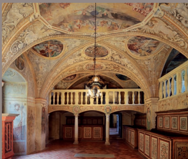
Celkový pohled ke kruchtě kaple sv. Barbory

Orientovaná renesanční kaple se nachází v severním křídle tzv. horního hradu. Kaple je tvořena malým presbytářem, uzavřeným třemi stranami šestiúhelníka a obdélnou lodí zaklenutou třemi poli křížové hřebínkové klenby. V západní části lodi je situovaná varhanní kruchta, nesená dvěma štíhlými sloupky s toskánskými hlavicemi, která na severní straně přechází v emporu. Na jižní straně závěru kaple je situovaná malá oratoř, přístupná z točitého schodiště věže. Kapli osvětlují dvě okna na jižní stěně a tři na severní empoe.