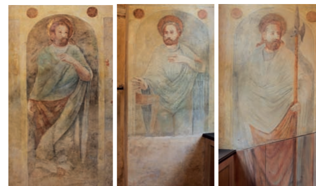
Apoštolé – sv. Juda Tadeáš, sv. Jakub Menší, sv. Tomáš

Obrazový cyklus začíná před oltářem, na severní evangelijní straně, obrazem Vjezdu Krista do Jeruzaléma, pokračuje západním směrem výjevem Poslední večeře, jejíž součástí je scéna Krista myjícího nohy svým učedníkům. Na počátku Kristových pašijí stojí scéna Kristus na hoře Olivetské, dále pokračují výjevy Zatčení Krista a Krista před Kaifášem, v jehož levé části je průhled do dalšího prostoru, kde se odehrává scéna Kristus před Annášem. Následují scény Vysmívání Kristu, Korunování Krista trnovou korunou, v průhledu v levé části tohoto výjevu je zobrazeno Bičování Krista a Nesení kříže. Na jižní stěně, pod tímto medailonem, je zachyceno Snímání z kříže, v navazujících východních lunetách Kladení Krista do hrobu a Sestup Krista do předpekli. V klenebních kápích závěru kaple kulminuje