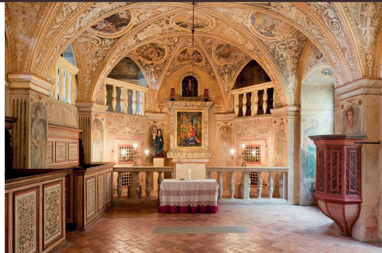
Celkový pohled do interiéru kaple sv. Barbory