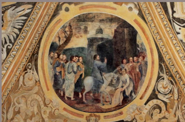
Vjezd Krista do Jeruzaléma