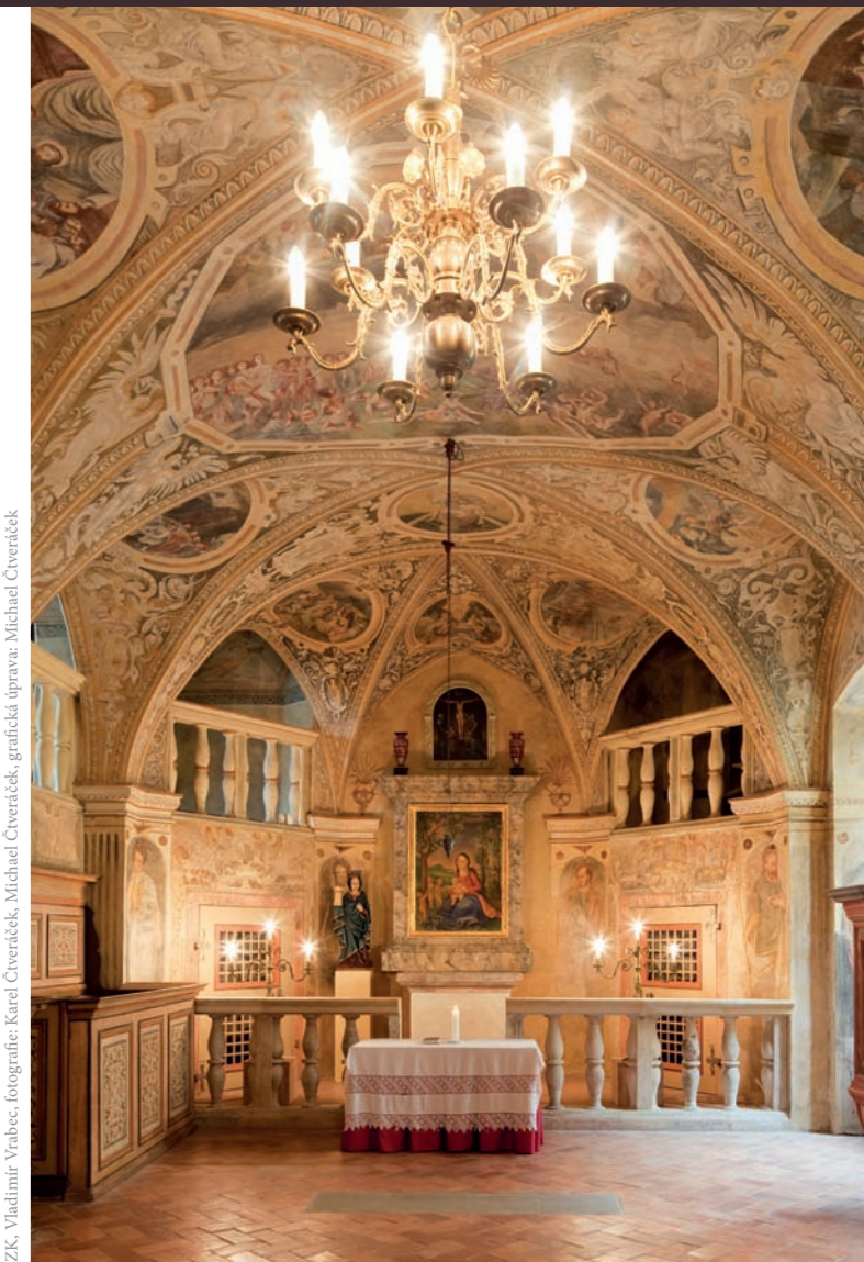
Text: Iva Bárťová, Jana Šubrtová, mapa: © ČÚZK, Vladimír Vrabec, fotografie: Karel Čverčáček, Michael Čverčáček, grafická úprava: Michael Čverčáček