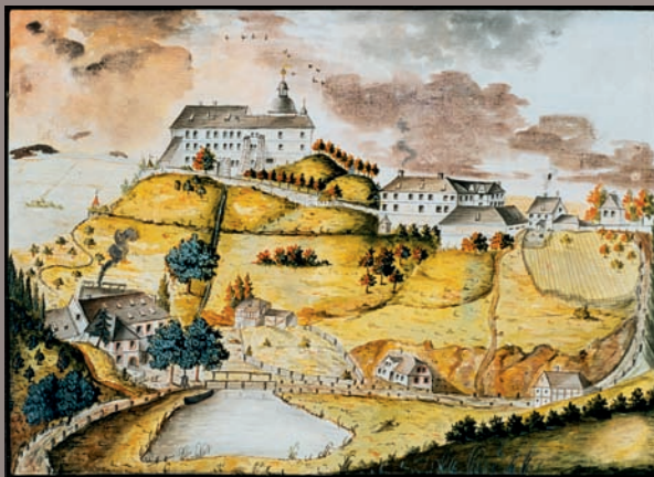
Vyobrazení Grabštejna z roku 1804 (SOA Litoměřice, pobočka Děčín, RA Clam-Gallasů, kart. 528, inv. č. 1917)

Areál hradu Grabštejn leží necelé tři kilometry východně od Hrádku nad Nisou. Vystavěn byl na strmém ostrohu nedaleko údolí Lužické Nisy, v místě, kde tok řeky opouští hornatou krajinu severočeského pohraničí a poté i území České republiky. Hradní kopec je s okolní krajinou spojen sedlem, v němž vnikl později hospodářský dvůr.