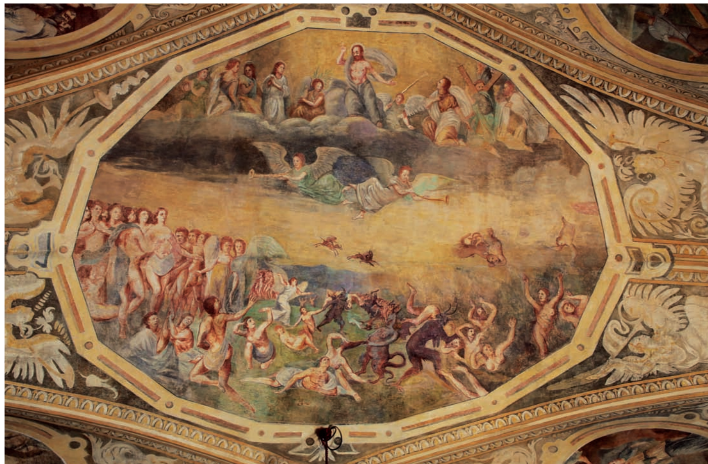
Ústřední medailon s vyobrazením Posledního soudu

Současná podoba kaple sv. Barbory souvisí s rozsáhlou renesanční úpravou hradu, která probíhala v letech 1564–1569. V této době došlo nejen ke stavebním úpravám samotné kaple, ale zejména k jejímu vyzdobení nástěnnými malbami a opatření novým interiérovým vybavením. Výmalba kaple byla provedena technikou fresco-secco, kdy byla do vlhké omítky nanášena podmalba a na zaschlý podklad malba. Malby jsou datované rokem 1569, letopočet se v kapli čtyřikrát opakuje na iluzivně malovaných tabulkách. Hlavním motivem malířské výzdoby kaple sv. Barbory jsou mnohafigurové christologické výjevy, doplněné alegoriemi Ctností, Neřestí, světců a dalšími, dnes neidentifikovatelnými postavami v pravouhlych či oválných