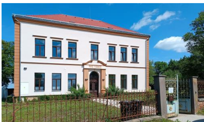
Obnovená budova bývalé školy

kdy ji nahradila nová historizující patrová stavba, postavená jako solitér mimo stávající zástavbu při cestě do Zachrašťan. V roce 1967 byla škola pro nedostatek žáků uzavřena. K Vysočanům patří i bývalý vodní mlýn, stojící samostatně jihovýchodně od vsi.