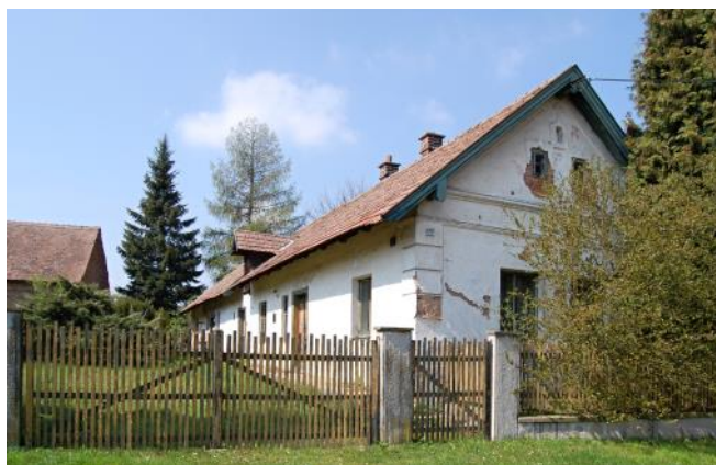
Dům čp. 49

patrová zděná budova dříve prosperujícího vodního mlýna. Voda sem byla přiváděna náhonem z řeky Cidliny. Náhon je již zasypaný, jeho průběh je však patrný dle vzrostlých vrb. Dle nápisové desky při vstupu do mlýnice mlýn dne