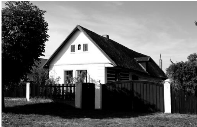
Dům čp. 13

Jihozápadně od obce, na samotě pod strání, dosud stojí