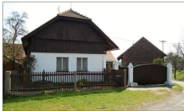
Dům čp. 9 Detail zákloповého prkna s nápisem, čp. 46

patrová zděná budova dříve prosperujícího vodního mlýna. Voda sem byla přiváděna náhonem z řeky Cidliny. Náhon je již zasypaný, jeho průběh je však patrný dle vzrostlých vrb. Dle nápisové desky při vstupu do mlýnice mlýn dne