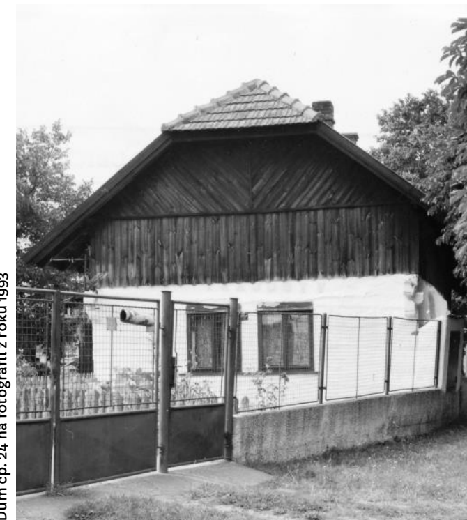
Dům čp. 24 na fotografiích z roku 1993

Společný hřbitov pro Vysočany a Zachrašťany nacházející se na půli cesty mezi oběma obcemi je vybaven kaplí, centrálním křížem a dřevěnou sloupovou zvoničkou.