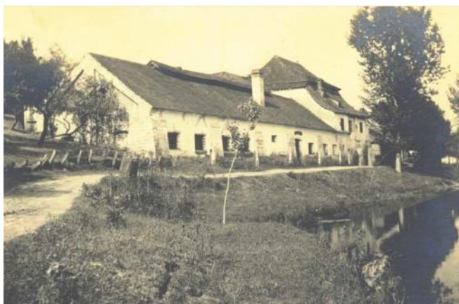
Již zaniklý pivovar na poč. 20. století

V roce 1823 byla ve Vysočanech zřízena škola sloužící i blízkým Zacharaštanům a Zábědovu. Samostatné budovy se škola dočkala až v roce 1856. Učilo se v ní do roku 1906,