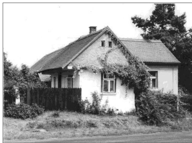
Dům čp. 56 na fotografiích z roku 1993