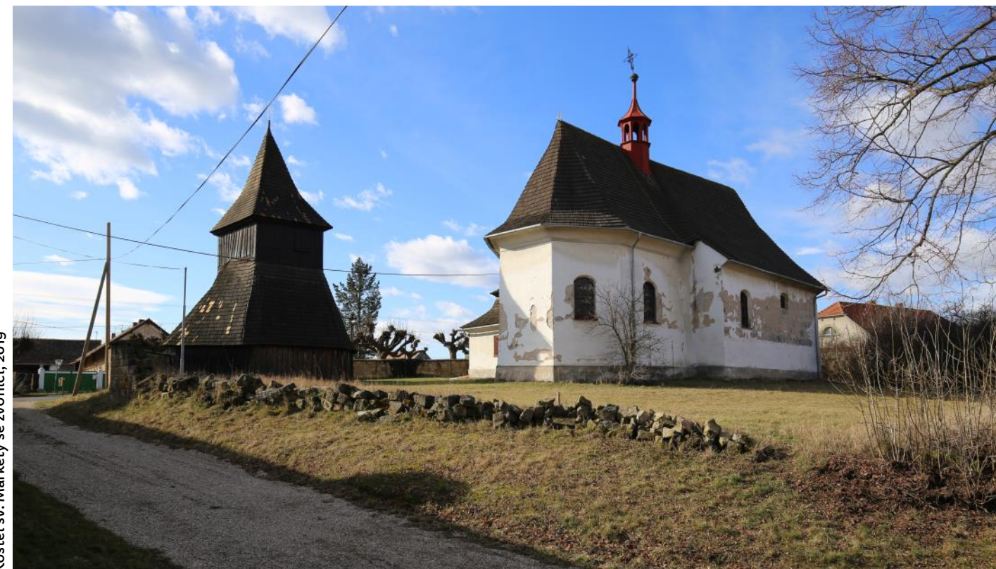
Kostel sv. Markéty se zvonici, 2019