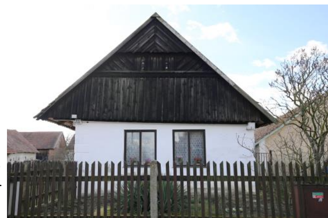
Dům čp. 35

Roubených domů se ve Vysočanech dochovalo hned několik. Mezi nejhodnotnější patří domy čp. 4, 13, 35, 46 nebo 56. Roubená konstrukce byla zvnějšku často olíčena vápennými nátěry nebo opatřena hliněnými či vápennými omítkami. Omítání nebo bílení roubených domů je zřejmě mladšího původu a rozšířilo se kolem poloviny 19. století v souvislosti s protipožárními předpisy a snahou připodobnit se zděným stavbám. Roubené domy čp. 13 a 35 byly na přelomu 19. a 20. století omítnuty a opatřeny štukovým tektonickým členěním, čímž se vizuálně velmi přiblížily zděným stavbám. Dům čp. 13 má ve štítovém průčelí bosované pilastry, rámování a profilovanou patrovou římsu i okenní šambrány. Z části dvorního průčelí byla později omítka odstraněna. Podobně je řešen i roubený dům čp. 35, ten si však uchoval dřevěný štít. Z dalších roubených staveb