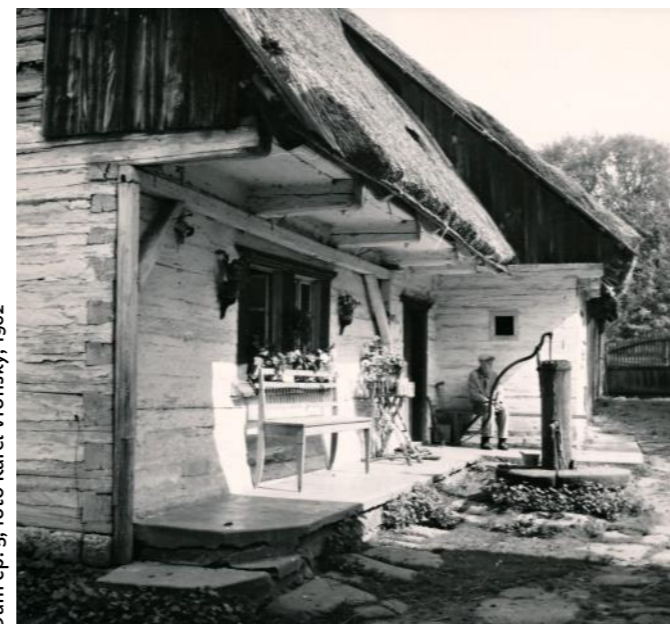
Dům čp. 5, foto Karel Vronský, 1962

polovině 20. století bylo bílení necitlivě a masově odstraňováno. Vápenný nátěr se dnes dochoval v patře domu čp. 4. Nově byl obnoven na roubení chlévů čp. 15. Nejznámějším tvůrcem a řemeslně vynikajícím tesařským mistrem soboteckého okruhu patrových staveb byl Josef Havlík, který žil přímo ve Vesci v čp. 10, kam se příženil ze sousední Střehomi. Havlík snad na Sobotce zavedl patrovou zástavbu. Po něm zde působil Jan Hortlík, který ve Vesci stavěl například dům čp. 7 (1833). Další tesař patrových