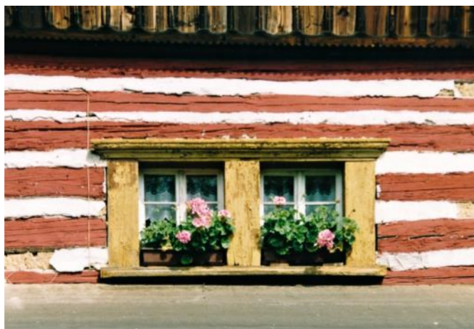
Sdružené okno v patře domu čp. 16

polovině 20. století bylo bílení necitlivě a masově odstraňováno. Vápenný nátěr se dnes dochoval v patře domu čp. 4. Nově byl obnoven na roubení chlévů čp. 15. Nejznámějším tvůrcem a řemeslně vynikajícím tesařským mistrem soboteckého okruhu patrových staveb byl Josef Havlík, který žil přímo ve Vesci v čp. 10, kam se příženil ze sousední Střehomi. Havlík snad na Sobotce zavedl patrovou zástavbu. Po něm zde působil Jan Hortlík, který ve Vesci stavěl například dům čp. 7 (1833). Další tesař patrových