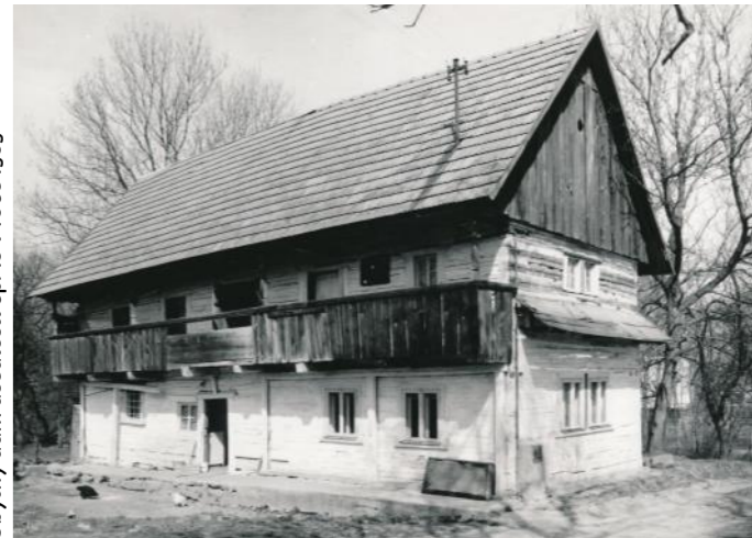
Obytný dům usedlosti čp. 18 v roce 1989

Jedná o lidovou pozdně barokní práci pravděpodobně Jana Zemana ze Žernova. Významným způsobem je vesnice dotvářena vzrostlými dřevinami v prostoru návsi nebo v zahradách usedlostí. Stromy jsou podstatným kompozičním prvkem vesnice. Dvě statné lípy doprovází sochu Nejsvětější Trojice, další lípy lemují rybník, volného prostoru je pak vzrostlý topol. Stromy zároveň pozitivně ovlivňují vnímání sídla jako celku zasazeného do krajiny. Malebnost vesnice dotváří i vodní plochy. Celkový dojem neruší ani stožáry elektrického vedení, které je kvůli filmovému natáčením již od roku 1983 umístěno pod zemí.