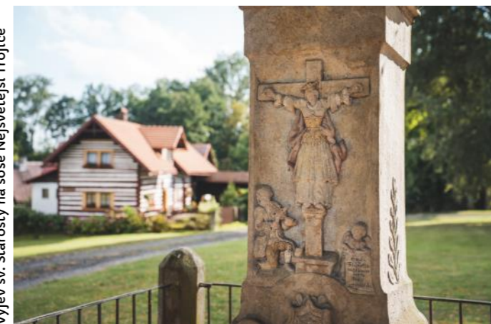
Výjev sv. Starosty na soše Nejsvětější Trojice

Zastoupena jsou i kamenosochařská díla – na návsi socha Nejsvětější Trojice z roku 1829 s reliéfem ne příliš často zobrazované sv. Starosty a při silnici spojující Sobotku a Podkost litinový kříž na kamenném podstavci ze staršího kamenného kříže s reliéfy Panny Marie bolestné, sv. Jana Nepomuckého, sv. Václava a sv. Isidora (oráče) z téhož roku.