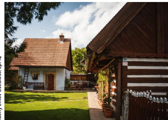
Zděný chlév usedlosti čp. 14

Hospodářské budovy chlévů a koníren (maštalí) stály většinou samostatně v rámci hospodářského dvora, někdy se také připojovaly k obytným stavením. Vždy ale měly samostatný vchod ze zápraží (např. čp. 3 nebo 11). Původně byly dřevěné konstrukce, později kamenné nebo cihelné. Mohutné cihelné budovy maštalí s půlštoky a středovými sedlovými vikýři z počátku 20. století situované paralelně s obytnými domy stojí při čp. 7, 12 nebo 15. Nad vchody je zdobí kamenné koňské hlavy. Menší, většinou