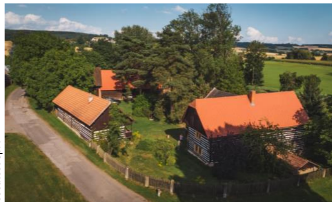
Usedlost čp. 1

Vesnice vznikla v nepravidelném terénu. Její morfologicky nejsložitější jižní část protíná potok protékající několika drobnými rybníky. Jedná se o návesní typ sídla s přibližně obdélnou protáhlou návší s nerovnoměrným zastavěním v jihovýchodní části, která je právě kvůli terénu a vodoteči odsunuta dál. Jádro vesnice představuje věnec volně rozestavěných usedlostí v půdorysném podkovovitě tvaru s relativně velkými plochami dvorů. Dominantní jsou hmotově výrazné usedlosti s patrovými roubenými domy rozmístěné v poměrně velkých rozestupech. Severozápadní a jihozápadní strany návsi jsou tvořeny usedlostmi založenými v řadě. Ze sevřeného tvaru je k hlavní komunikaci vysunutá pouze usedlost čp. 16 s dřívějším provozem krčmy či zájezdního hostince. Plužina v přímém okolí sídliště je záhumenicová, za silnicí traťová.