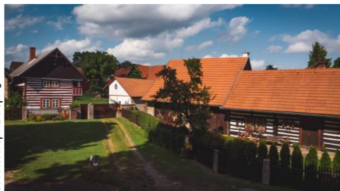
Usedlosti čp. 12 a čp. 13

vila čp. 25 situovaná na druhé straně komunikace propojující Podkost a Sobotku. Před začátkem druhé světové války je evidováno 115 obyvatel, po válce jejich počet postupně klesá – v roce 1950 je to 87 obyvatel, v roce 1980 už jen 42. Dle sčítání z roku 2021 je ve Vesci hlášeno jen 31 obyvatel. Původní hlavní obživou ve vesnici bylo zemědělství, a to mělo zásadní vliv na podobu zástavby. Kromě jiného se zde v minulosti pěstoval také chmel.