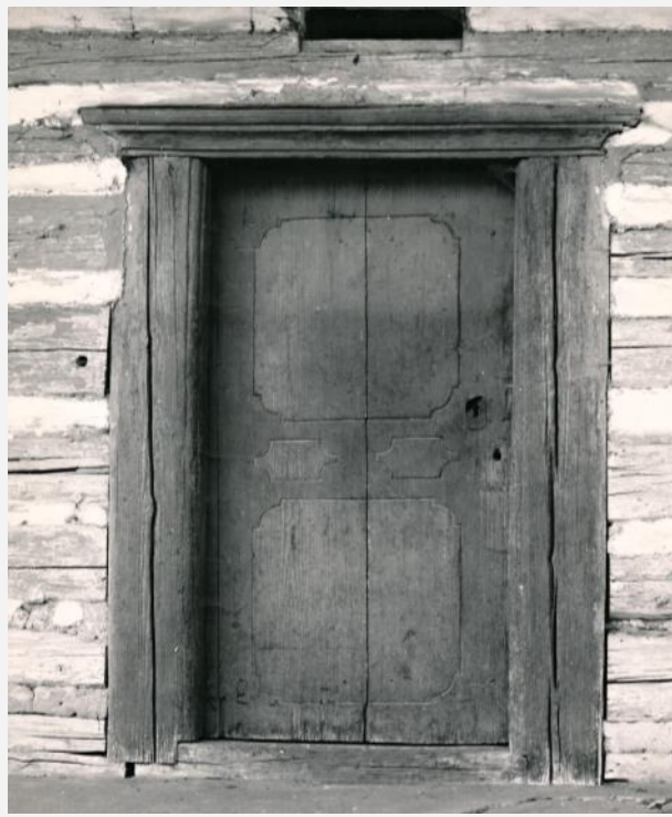
Dveře již zaniklého domu čp. 8, foto Karel Vronský, 1962

V architektonické hmotové skladbě sídla dominují dodnes obytné patrové domy z poslední čtvrtiny 18. století a první čtvrtiny 19. století. Sobotecko spolu s Turnovskem patří mezi dvě oblasti Českého ráje, kam pronikl patrový roubený dům vývojově odkazující k široké oblasti severočeského domu obývané německým etnikem. Obytné domy jsou výhradně štítově orientované, mají tradiční trojdílné půdorysné uspořádání komorového typu s přední světnicí, síní s kamennou klenutou níkovou černou kuchyní a dvojicí komor (šatní a spížní, z nichž jedna mohla být obytná) v hospodářské části domu. V koutu světnice bývalo otopné zařízení s chlebovou pecí a kachlovými kamny.