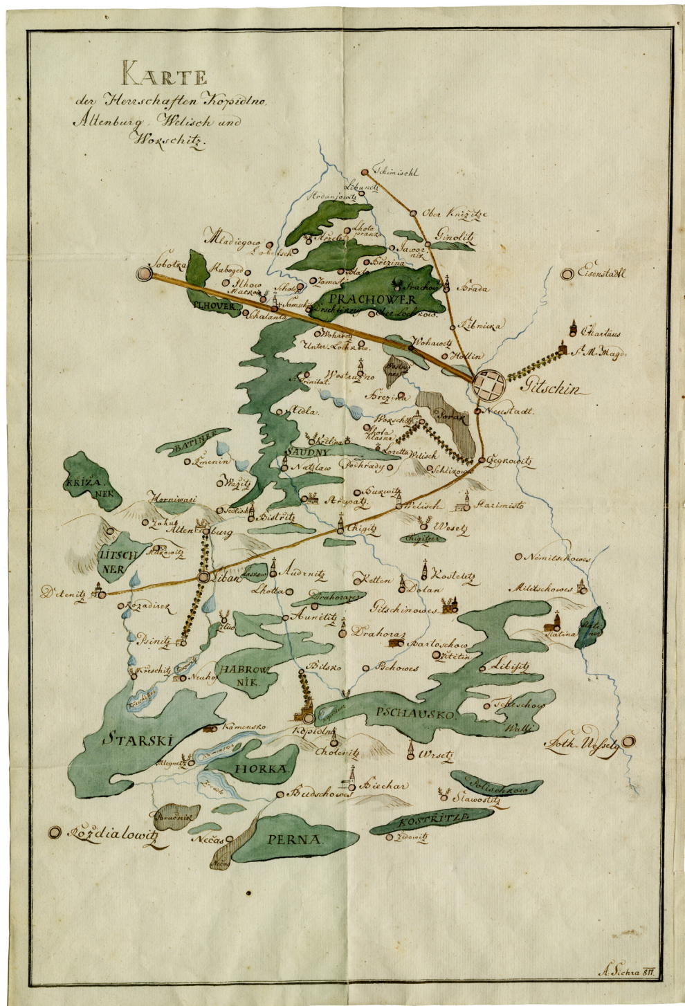
30b Mapa panství Kopidlno, Staré Hradý, Jičíněves a Vokšice. Kresba A. Sichy z roku 1811.