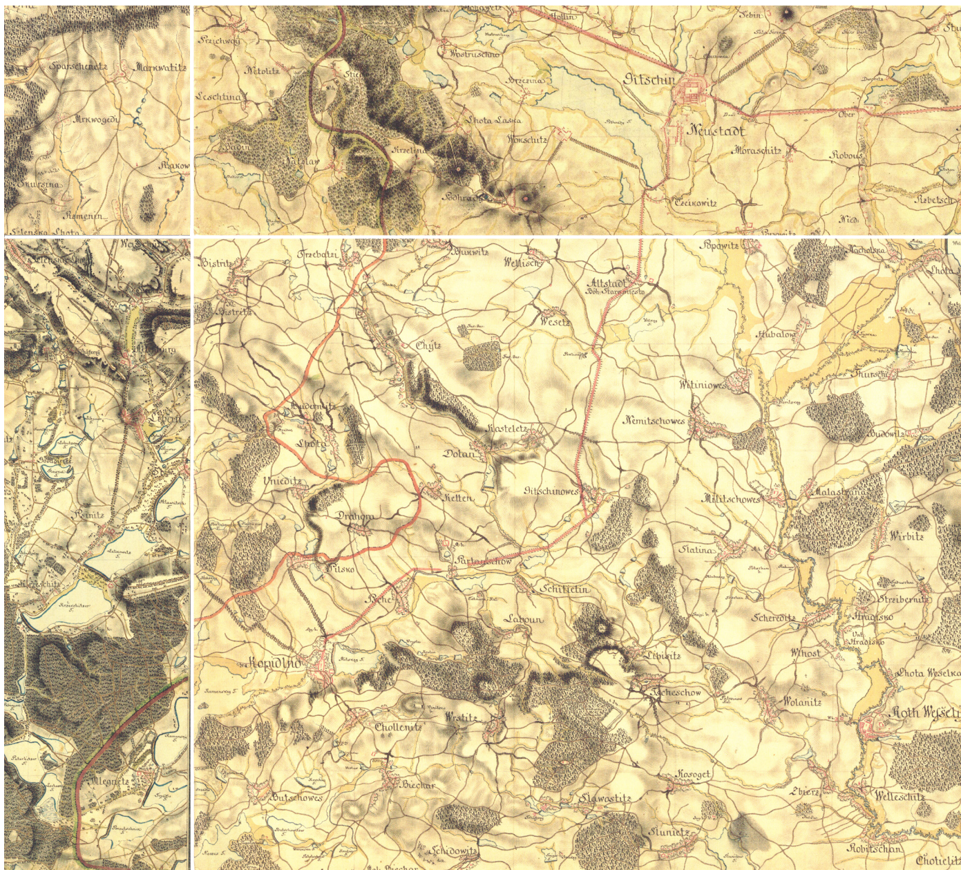
31 Šlikovská panství v letech 1780–1781 na mapě I. vojenského mapování.