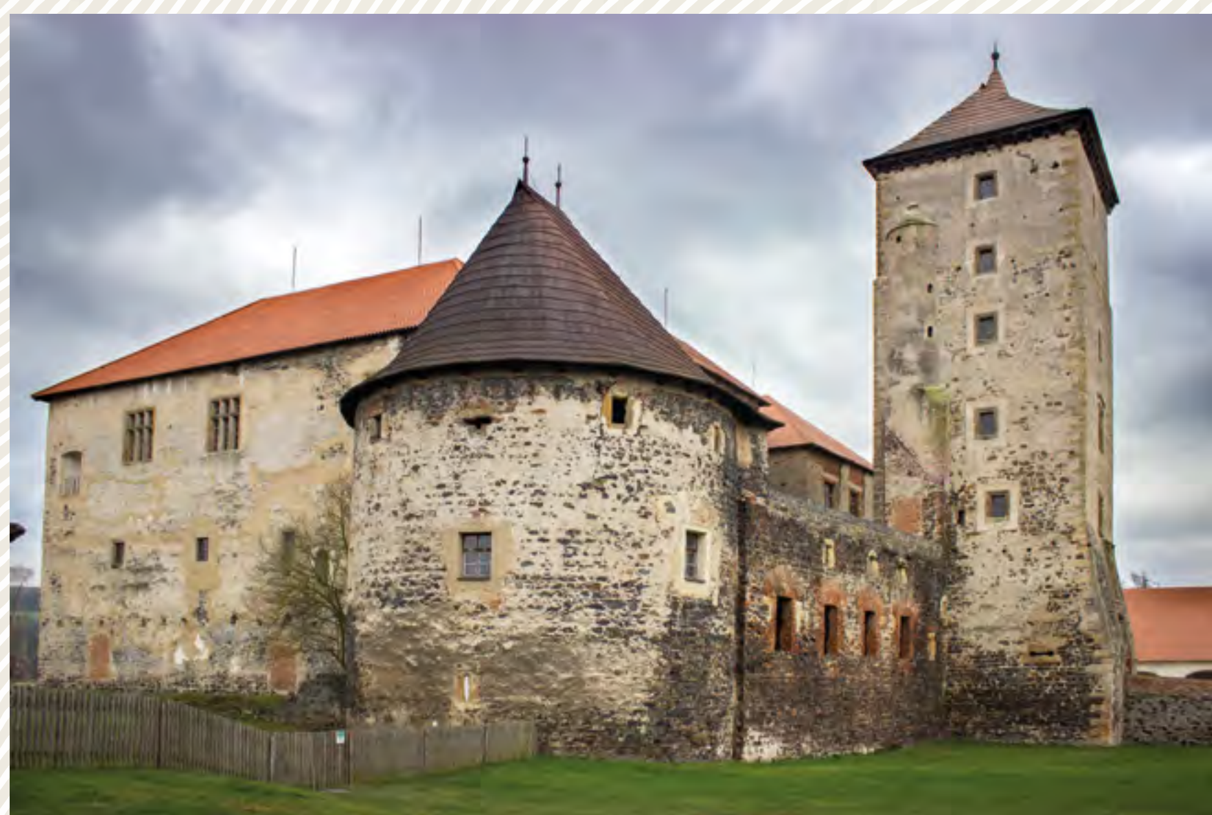
Svihov – na hradě byl v roce 2017 prováděn archeologický výzkum ke zjištění podzemního stavu původních středověkých pochůzkových vrstev.

Klíčovou organizací chránící a pečující o archeologické hodnoty je Národní památkový ústav, a to nejen jako správce významného počtu památek v České republice, ale i jako odborná organizace, která poskytuje výkonnému orgánu odborná vyjádření pro závazná stanoviska, např. při obnovách a rekonstrukcích památek. Tato písemná vyjádření mají mimo jiné posoudit míru a rozsah ztráty památkových hodnot, ke kterým může dojít v důsledku oprav památky.