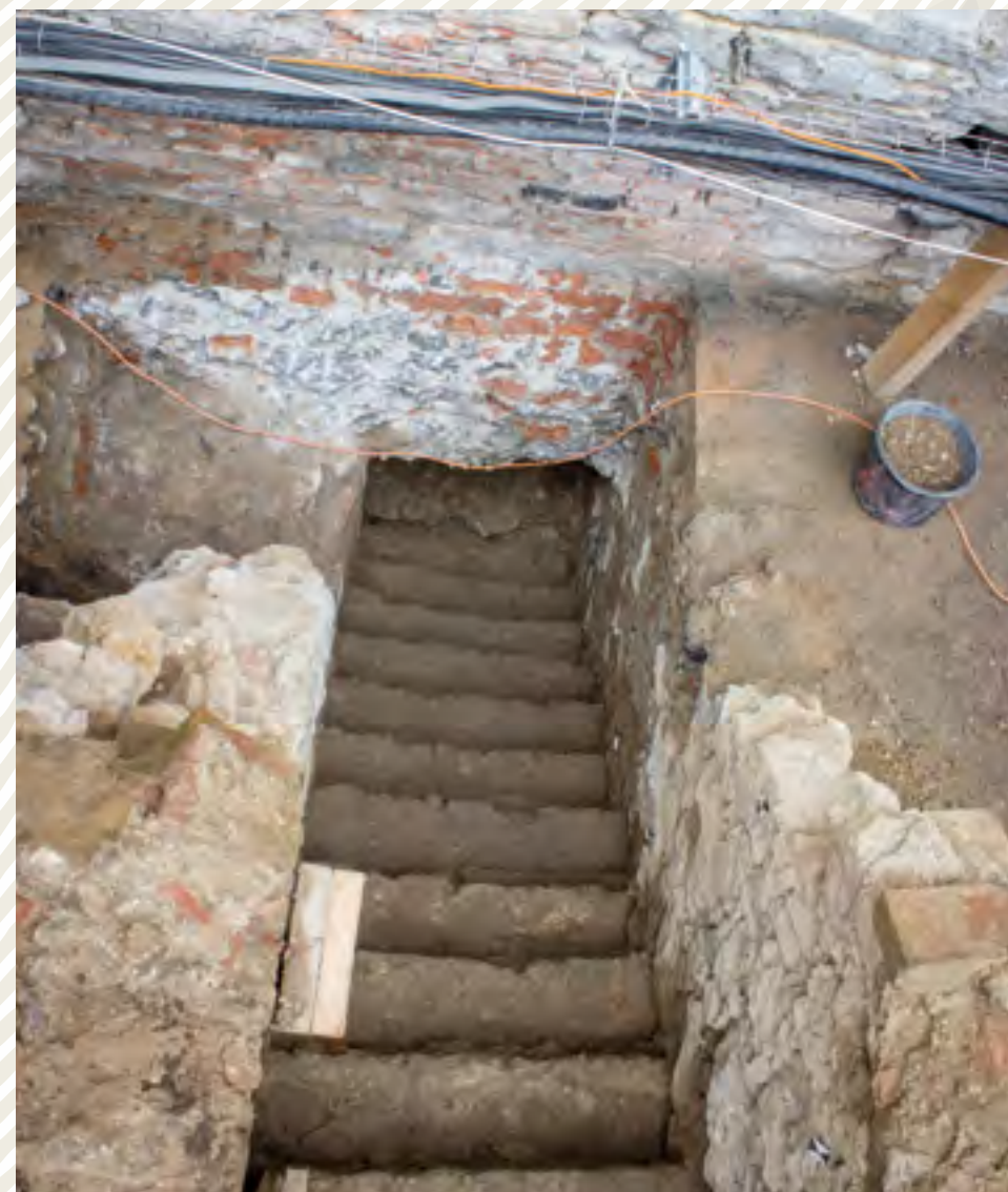
Karlštejn – pohled do odkryté sondy před purkrabstvím. Na fotce je patrné suterénní schodiště dnes již neexistující části budovy. Foto: J. Pařez, 2021

Památková archeologie prosazuje preventivní přístup k péči o archeologické dědictví. V praxi to znamená, že se snaží už v době přípravy projektu obnovy památek upozorňovat na rizika spjatá s terénními zásahy, maximálně využít existující archeologické poznatky o lokalitách a v případě možných budoucích střetů s plánovaným projektem hledat s projektanty a investorem jiná řešení. Mezi další preventivní opatření patří provedení zjišťovacího archeologického výzkumu. Probíhá v dostatečném předstihu před projektem a je prováděn v menším rozsahu, než by bylo nutné u záchranného archeologického výzkumu, který až na výjimečné případy neumožňuje ochranu nálezů in situ.