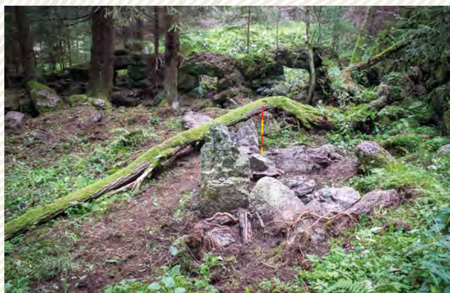
Pohoří na Šumavě – pohled na zaniklou budovu hamru (vodokovárny) z 19. století. V popředí se nachází relikt kamenných sloupů, které držely kobylu; v pozadí jsou vidět 3 obslužné otvory pro vodní kola.

Památková archeologie spatřuje hodnoty i v památkách, které nejsou zapsané do Ústředního seznamu kulturních památek, a věnuje pozornost i ostatnímu dosud bližší nepoznanému archeologickému dědictví, které vyhledává, eviduje a monitoruje jeho stav. Tyto archeologické památky se nalézají jednak v zalesněném prostředí, kde jsou zpravidla lépe dochované (ať už se jedná o zaniklé vesnice, mohylová pohřebiště, hradiště či zaniklé středověké rybníky) a jednak v agrární krajině, kde je možné setkat se s pozůstatky novověkých polních opevnění, středověkých polních systémů či se zaniklým pravěkým ohrazením.