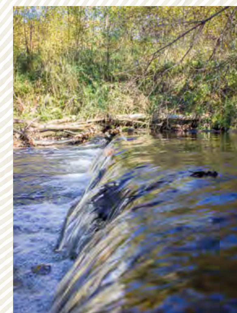
Relikty jezu na Pohoříském potoce – průzkum konstrukce zaniklého jezu odhalil dochované pozůstatky trámů na dně říčky.