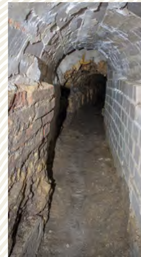
Strahovský klášter, Cedrový dvorek – vnitřní část revitalizované kanalizace. Obnovu bedlivě sledovali archeologové ve spolupráci s investorem na citlivém zachování historických konstrukcí.

Ideální výsledek poznání podzemní situace vychází z mezioborové spolupráce (archiváře, stavebního historika a archeologa) a využití nedestruktivních metod, jež poskytují lépe či hůře čitelný obraz bez nutnosti zásahu do terénních situací.