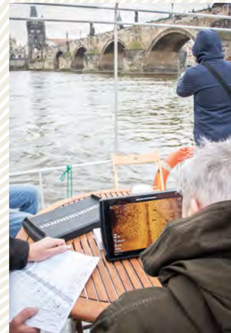
Výzkum Juditina mostu (2019) – geofyzikální průzkum pod vodní hladinou Vltavy v oblasti Juditina mostu zachytil středověké a novověké kůly a části pilířů Juditina mostu (průzkum prováděla ARCHAIA).