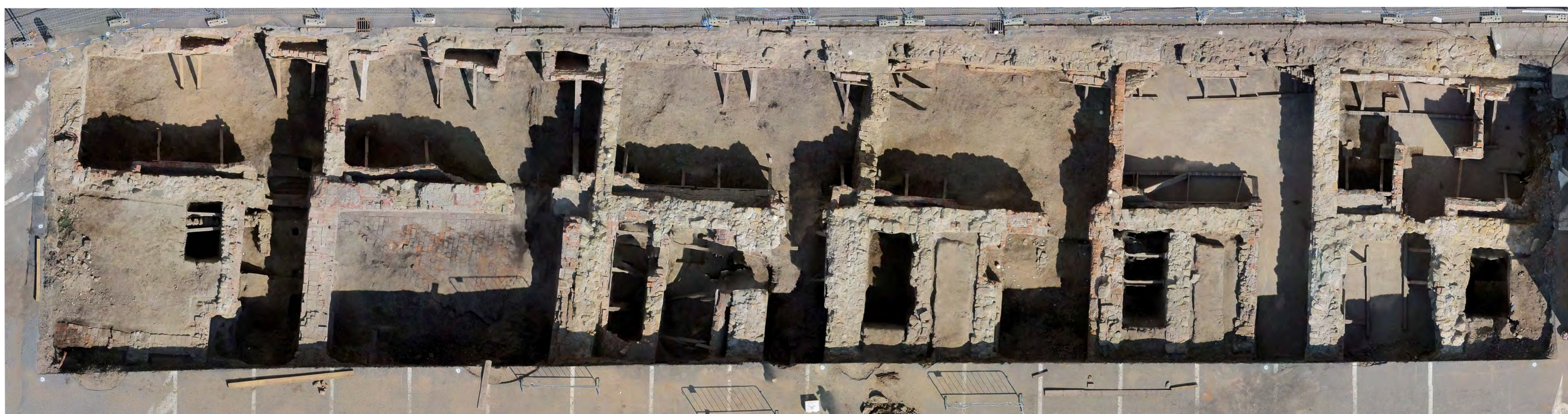
Ortofotomapa lokality. Celá plocha výzkumu byla zdokumentována fotogrammetricky z dronu i fotoaparátem (svislé plochy) a zároveň proběhlo 3D skenování pro účely vytvoření 3D modelu.

Východní profil v sondě 5 (čp. 54). Nejstarší fáze zástavby reprezentují podlahové vrstvy v pravé části profilu (k. 127, 128, 131), později zde vzniká zahlabený suterén (k. 537), který je na přelomu 14. a 15. století zasypán. Bohužel pozdějšími zásahy, především během demolice v 60. letech 20. století, byla horní část souvrství zničena, čímž zanikla úroveň, ze které byly hloubeny kamenné sklepy (zeď vlevo, k. 916). Nejstarší části dochovaných sklepů jsou na základě stavebněhistorického průzkumu kladeny do 2. poloviny 15. století.