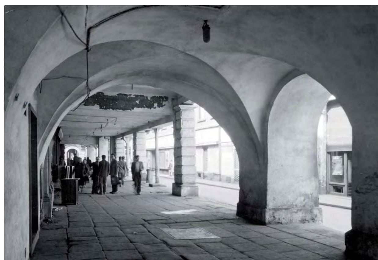
Pohled skrz podloubí („lauby“) při ulici Velké, směrem od čp. 54 (přelom 50. a 60. let 20. století).

Místo výzkumu (červeně) na tzv. císařském otisku stabilního katastru (1833). Čelní části úzkých středověkých parcel při ulici Velké zabírají původní měšťanské domy, za kterými se rozkládají zahrady a drobné stavby většinou hospodářské funkce. V průběhu 19. století bude zadní část parcel zastavěna a vznikne téměř jednolitý domovní blok vymezený ulicemi Muzejní, Pivovarská, Dlouhá a Velká.