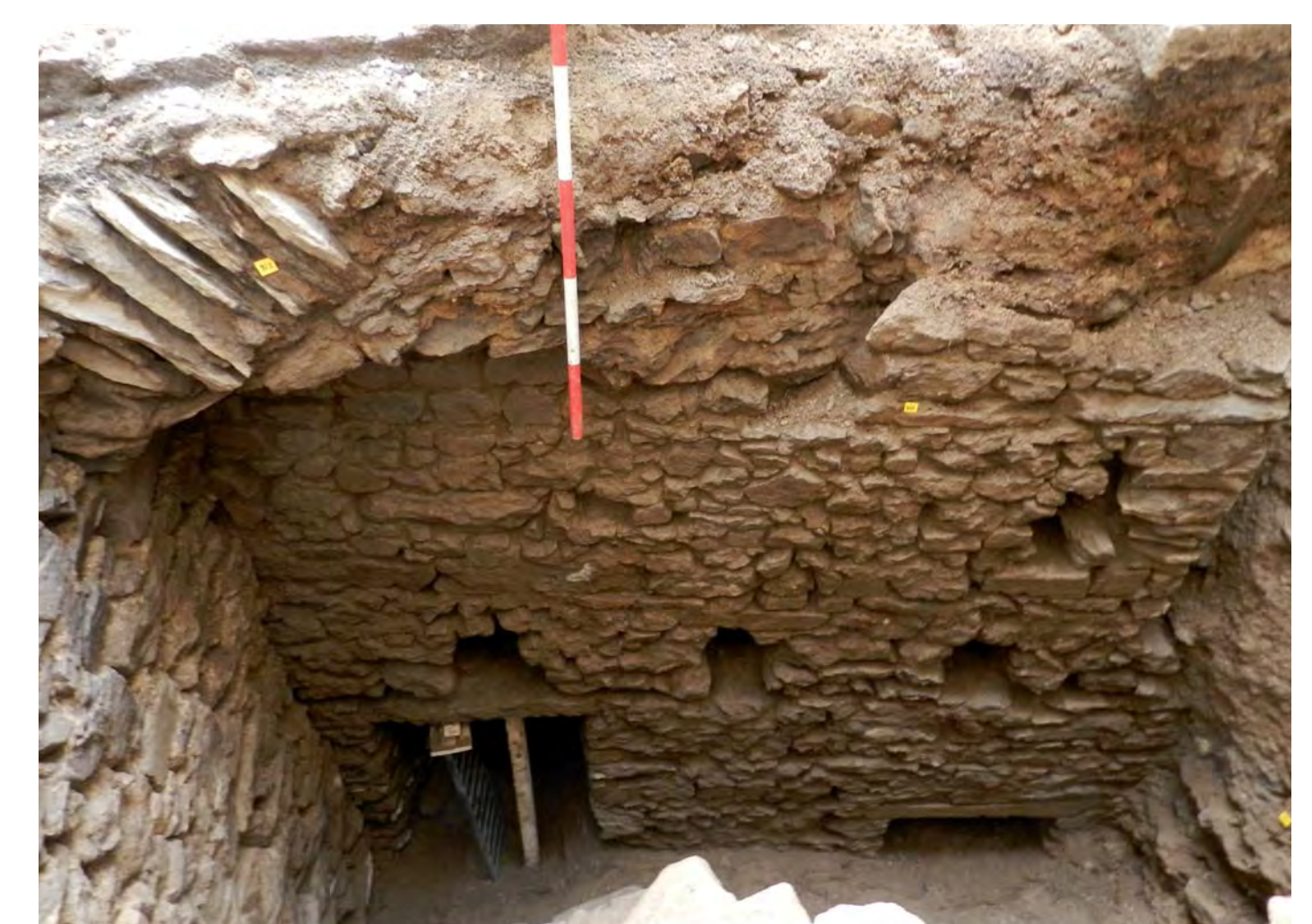
Sonda VII.

V sondě v zámecké zahradě těsně u vchodu do renesančního křídla, kde se dnes nachází obřadní svatební síň, bylo v malém prostoru vymezeném sondou několik kostrových pohřbů nad sebou v anatomické poloze na zádech, orientovaných hlavou k západu. Pohřby byly bez milodarů a datovacího materiálu a část z nich byla poškozena mladší cihlovou zdí postavenou u zazděného vchodu z mladšího období, patrně při úpravách zahrady v 19. století. Vzhledem k absenci hrobové výbavy typické pro středověk a poměrně velké vzdálenosti od farního kostela lze vyslovit hypotézu, že se jedná o součást ještě středověkého pohřebiště, které se nacházelo v blízkosti dosud neznámé svatyně.