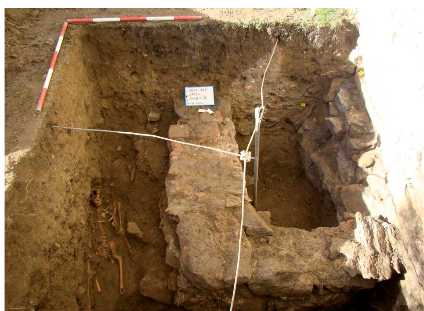
Sonda č. IX v zahradě.

Nejdůležitějším nálezem v sondě VII je zeď č. 921, pohřbená asi 30 cm pod dlažbou dvora a renesančním schodištěm, datovaným do roku 1563, která není kolmá na žádnou ze stávajících zdí na malém dvorku. Na její východní interiérové straně se nachází dva průrazy pro okna nebo dveře, jeden menší výklenek, zřejmě nika pro vestavěnou skříň, a v jedné rovině se nacházející tři kapsy pro trámy, které nesly dřevěný strop a podlahu, nejspíše mezi sklepem a přízemím/suterénem. Výzkum sondy musel být z bezpečnostních důvodů ukončen v hloubce 4 m. Podle situace ve sklepě sousedního paláce lze soudit, že původní úroveň, na níž byl hrad v 2. polovině 14. století postaven, se nachází 5–6 m pod současnou úroveň terénu. Dispozice jádra hradu byla mnohem odlišnější od dnešního stavu, než se dosud soudilo.