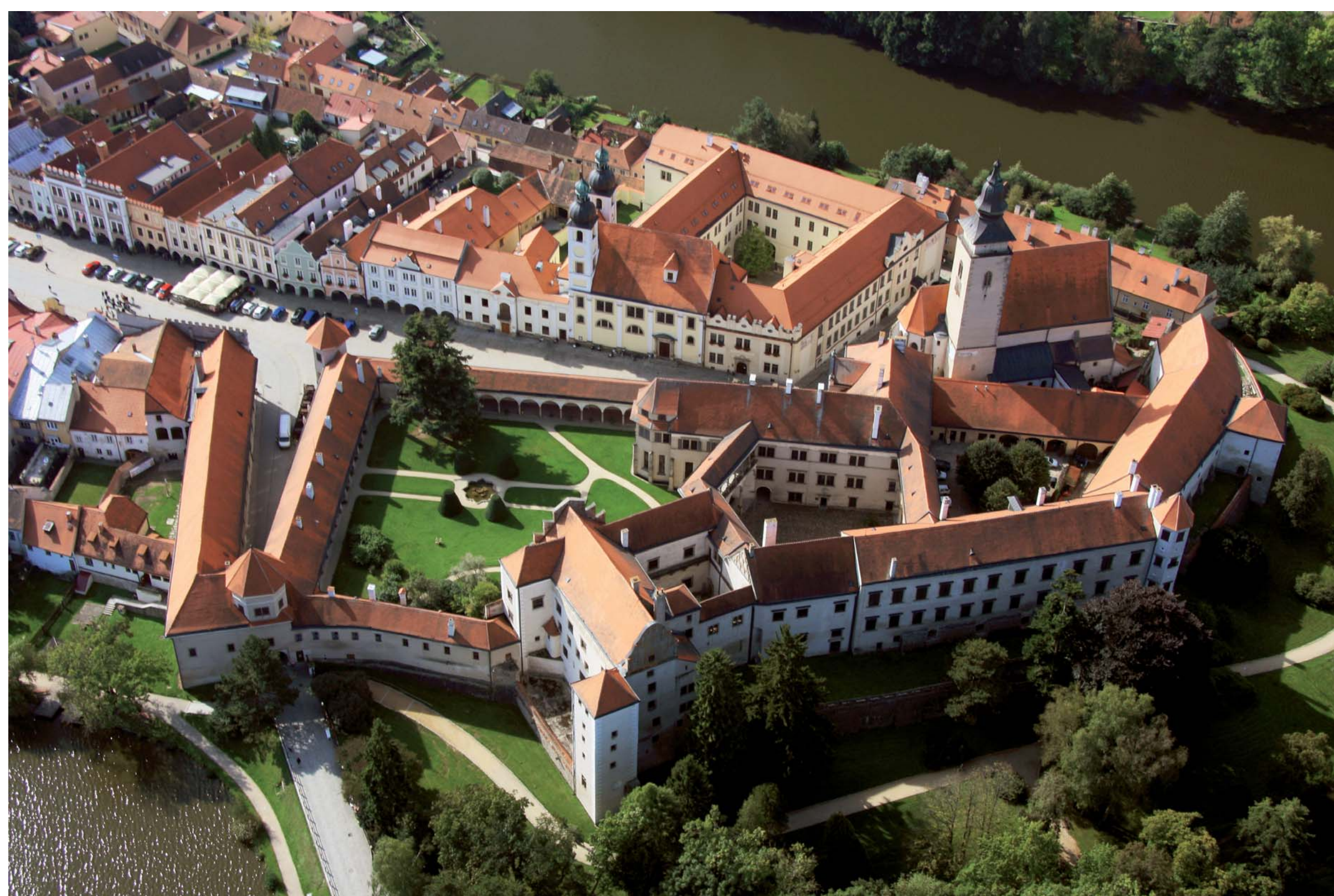
Zámek v Telči od severu.

Zachariáše z Hradce 1 – Zámek – stavební úpravy.“ Projekt byl financován z prostředků Programu pro podporu záchranných archeologických výzkumů.