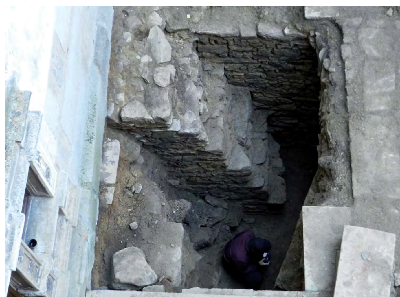
Malý dvorek.

Na malém dvorku, v místech předpokládaného středověkého jádra hradu, bylo v sondě VII odhaleno několik zdí do hloubky až 4 m pod stávající dlažbou. Tyto kvalitní kamenné zdi tvořily pravděpodobně stěny původního paláce gotického hradu, jehož suterén a sklepní prostor nebyly při pozdně gotické přestavbě hradu či renesanční přestavbě na zámek v druhé polovině 16. století zcela rozebrány, ale zasypány stavebním a kuchyňským odpadem. Odpadní vrstvy obsahovaly četné zlomky keramických nádob, jejichž užití v hradní kuchyni můžeme rámcově datovat do 15. století. Dostaly se sem při úpravách středověkého hradu na konci 15. století, méně pravděpodobně v souvislosti se stavbou renesančního zámku Zachariášem z Hradce v padesátých letech 16. století.