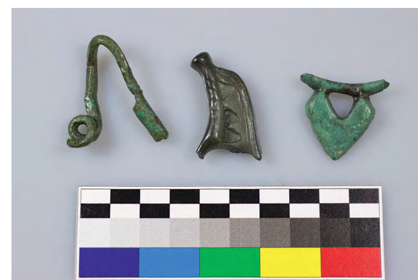
Kolekce vybraných archeologických nálezů souvisejících s pravěkým osídlením zkoumaného prostoru