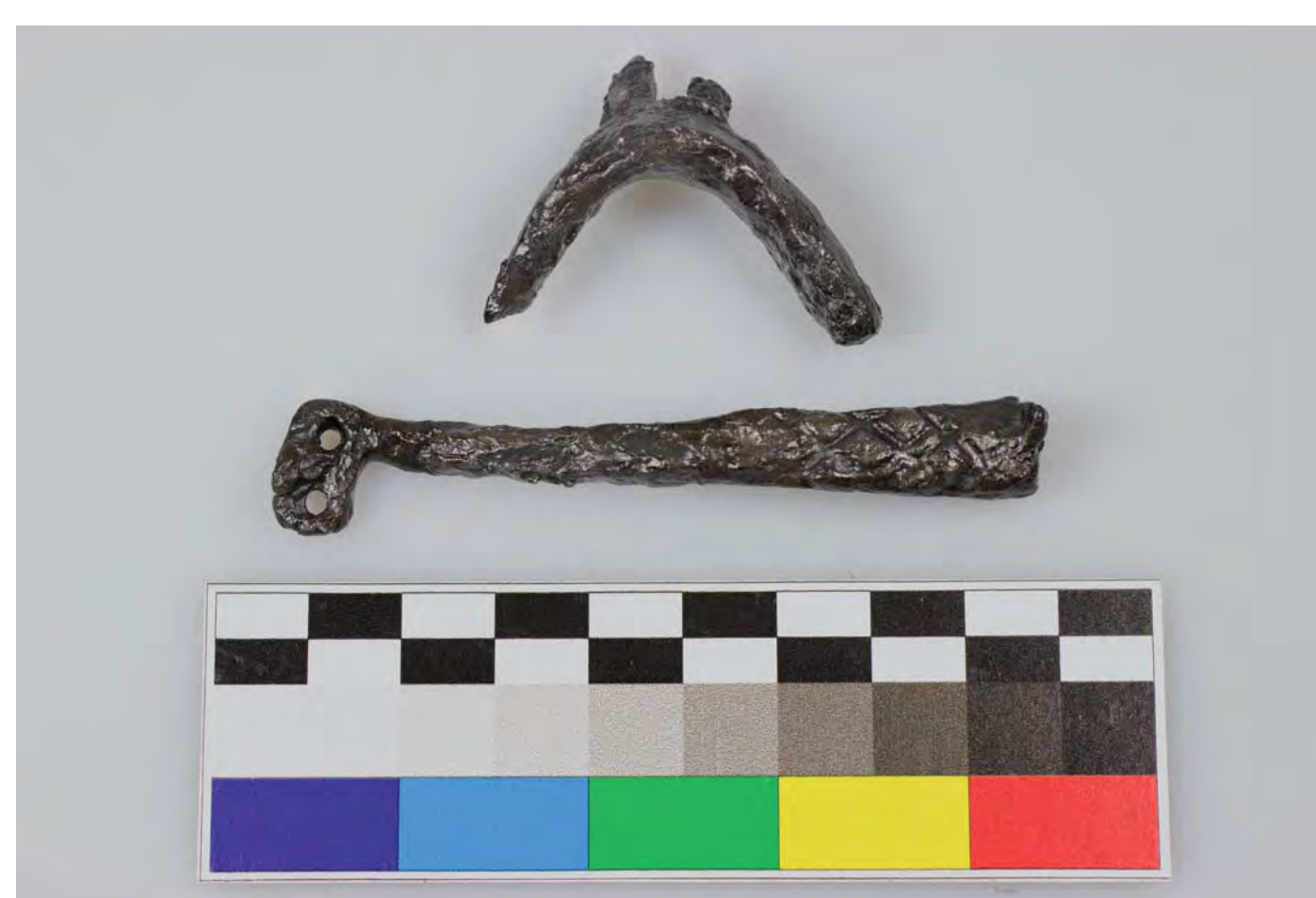
Zlomky ostruh z areálu bojiště