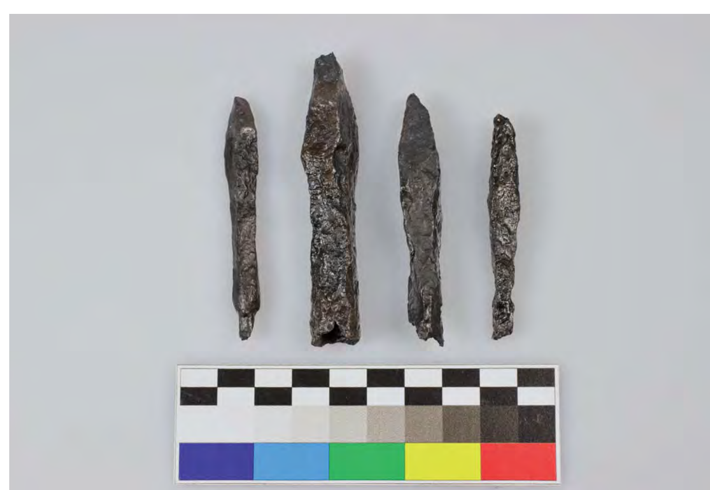
Výběr hrotů strel do kuše z areálu bojiště