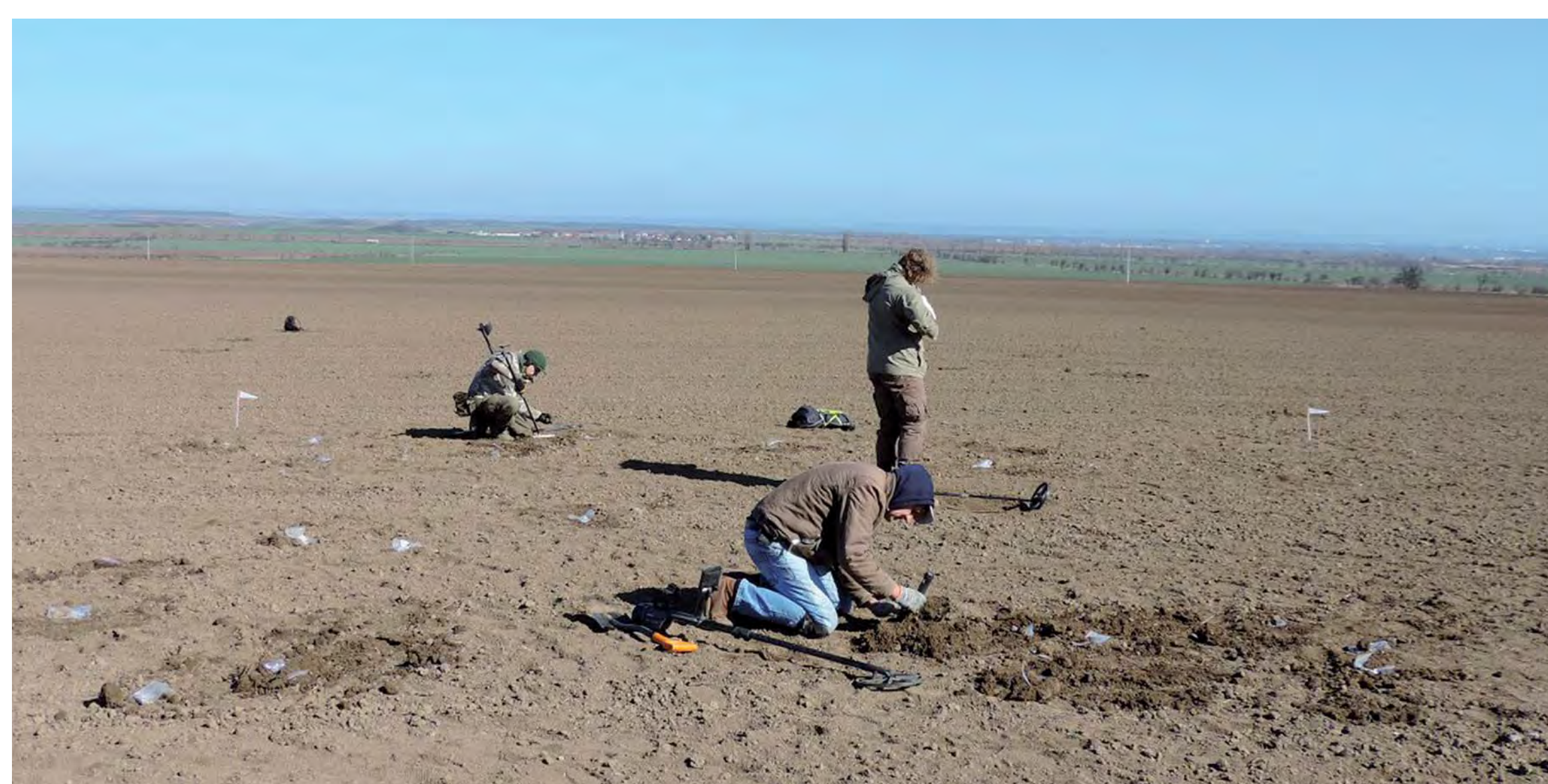
Terénní prospekce bojiště