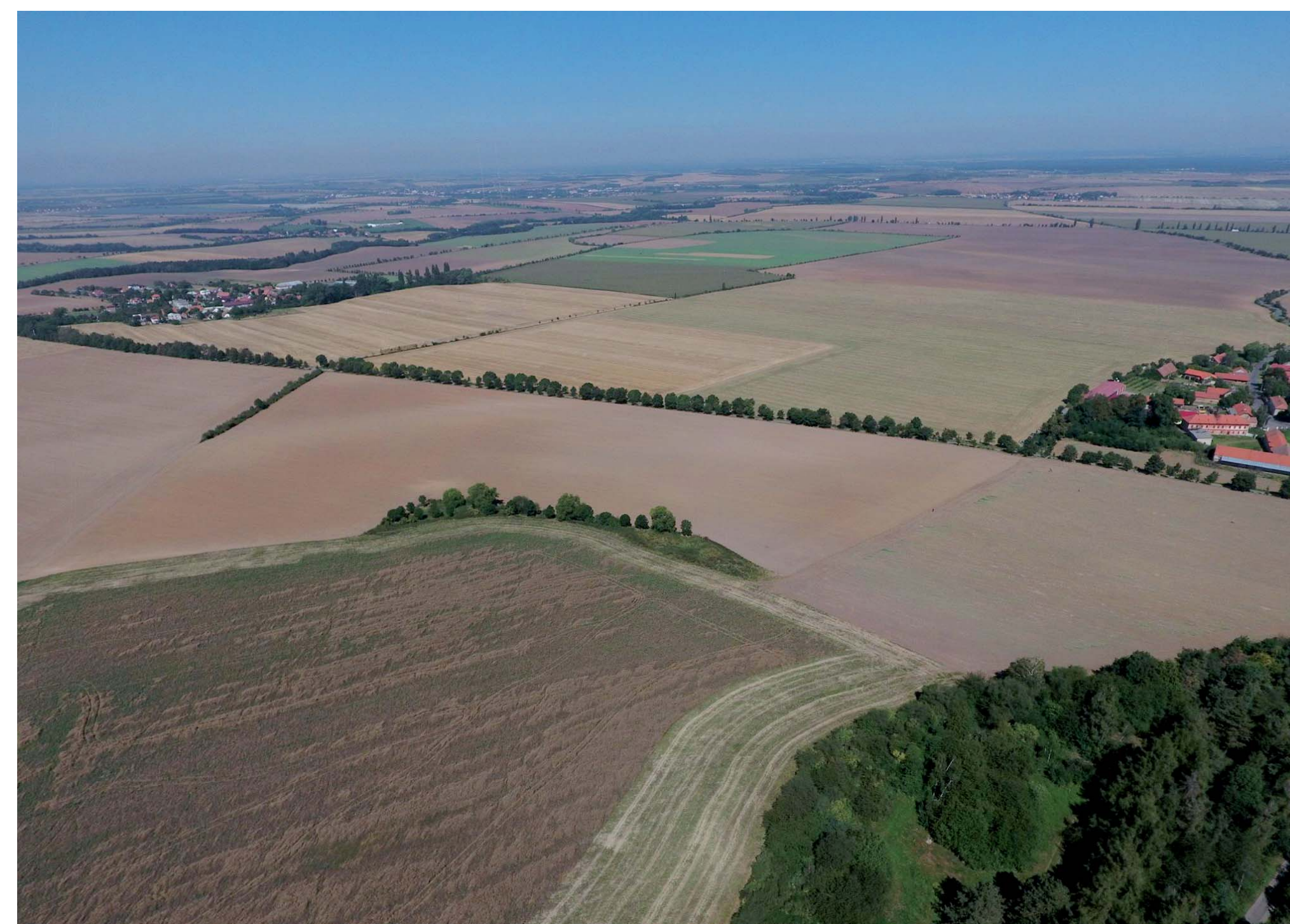
Letecký snímek zájmového území