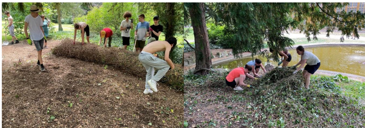
Práce dobrovolníků z řad studentů Gymnázia Open Gate

Tak jako každý rok, ani letos jsme nezanedbali údržbu prostor rozsáhlého zámeckého parku. Údržba se týkala jak horní, tak i spodní části rozsáhlého anglického parku. Dřeviny, které již nebyly v úplné kondici a ohrožovaly tak bezpečnost návštěvníků, byly odstraněny a nahrazeny dřevinami novými. Odstranili jsme i nežádoucí náletové dřeviny.