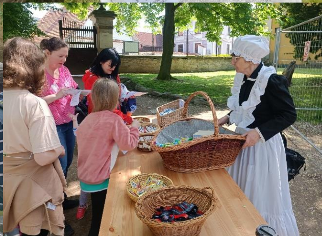
Harrachovské letohrádky – dětský den