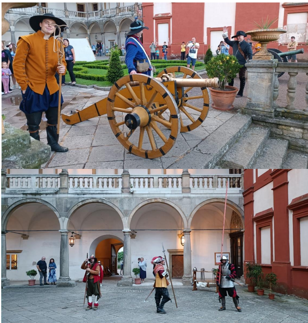
Třicetiletá válka na Opočně – noční prohlídky zámku s programem