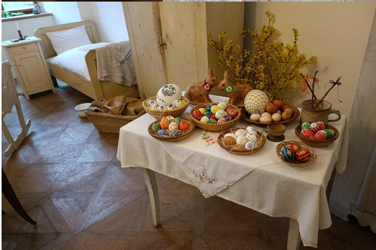
Velikonoční výstava v prostorách bývalé zámecké kuchyně