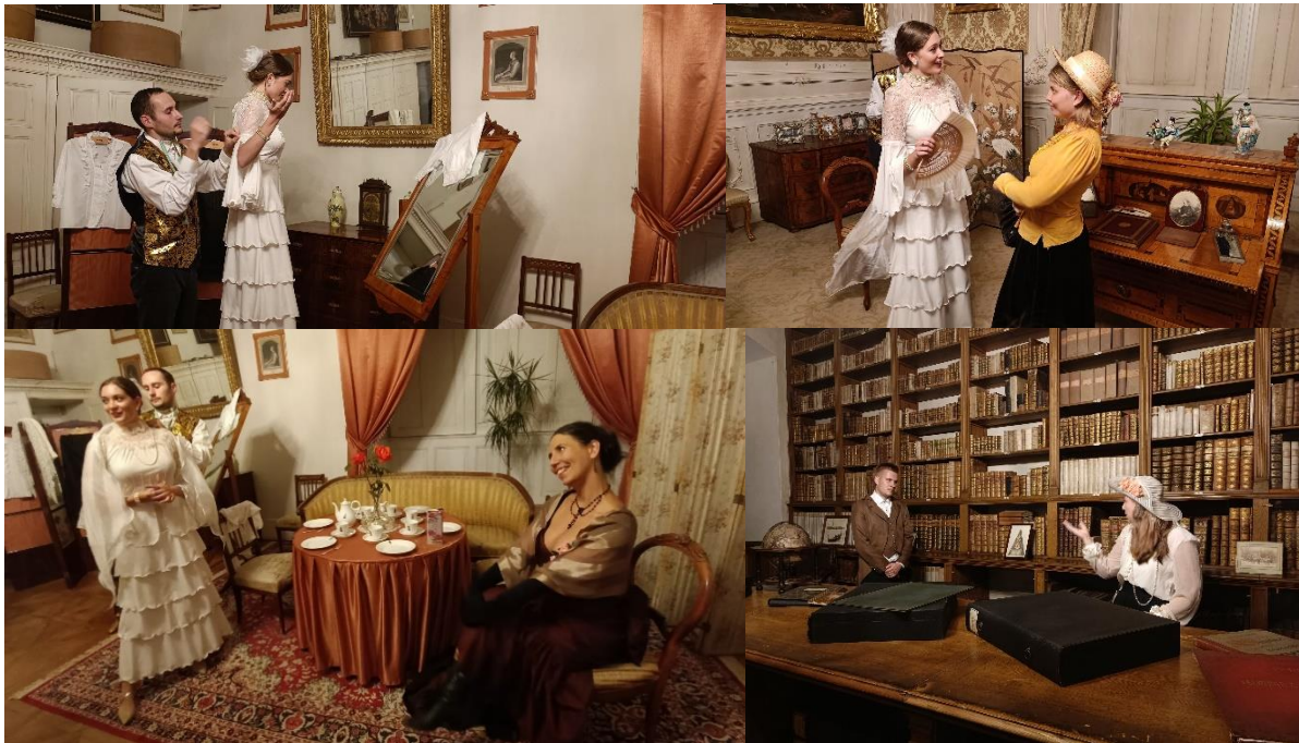
Hradozámecká noc – kostýmovaná noční prohlídka