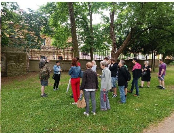
Víkend otevřených zahrad – projížďky kočářem a komentované prohlídky parku