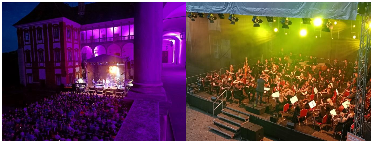
Kultura pod hvězdami – představení na nádvoří zámku

I návštěvnost akcí, které se neodehrávali v režii zámku, jako např. muzikálová, koncertní a činoherní představení nebo sokolnické podzimní setkání pod širým nebem arkádového nádvoří nebo v prostorách velké obrazárny, byla vynikající.