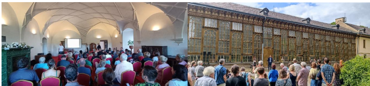
Přednáška v zámecké tabulnici- „Cesta na popraviště – hrdelní právo v Čechách“

Zámecká bývalá kuchyně nabídla několik volně přístupných výstav. Tabulnice se otevřela přednáškám, tanečnímu večeru, který byl závěrem celodenní akce „Letní empírová slavnost“ a svatebním obřadům. Opomenut nezůstal ani palmový skleník v horní části parku, kde se konaly v letních měsících výstavy města Opočna.