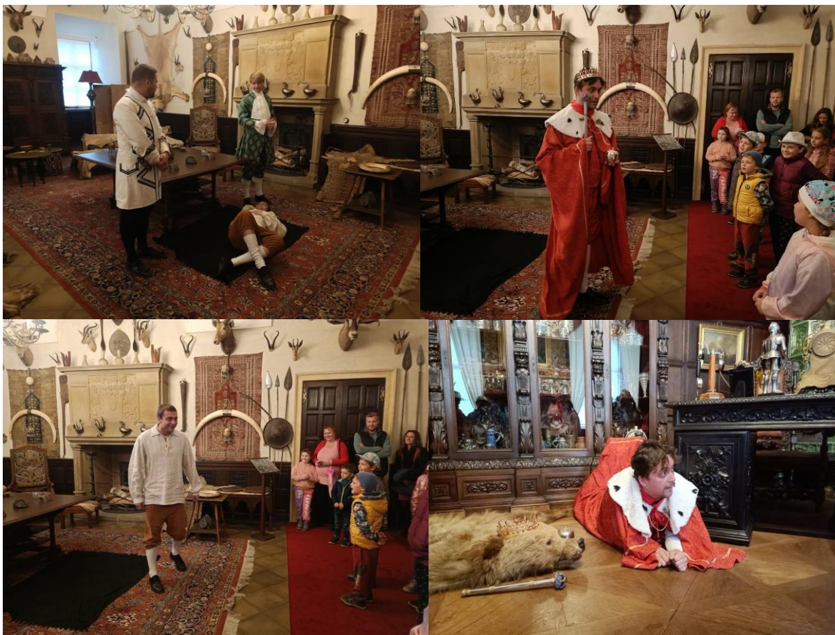
Pohádka na zámku „Rozum a štěstí“