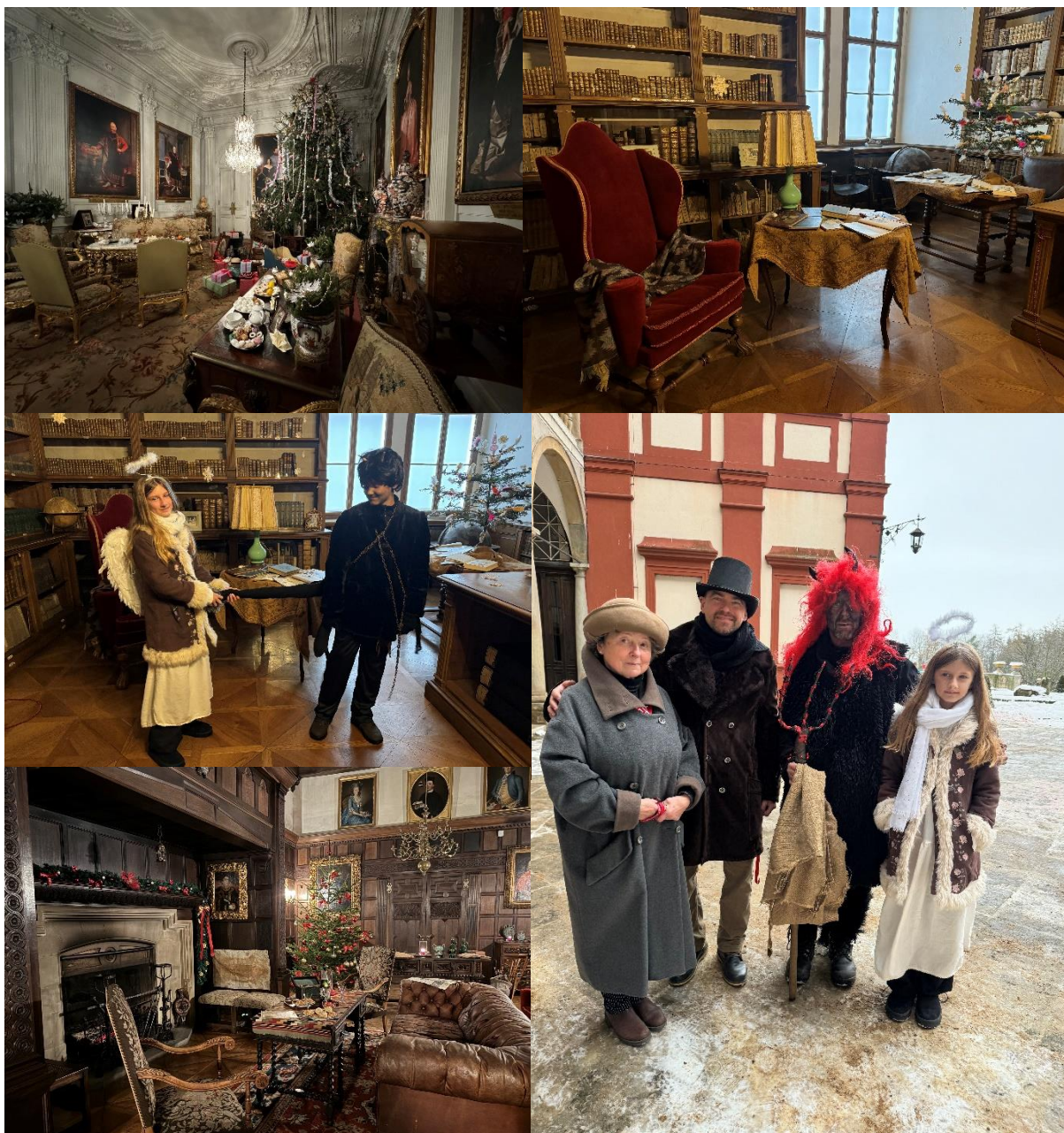
Adventní prohlídky a zámecký jarmark

Za každou úspěšnou zámeckou akcí stojí spousta práce, příprav, myšlenek a nápadů, pracovního nasazení, odhodlání a kreativita celého kolektivu a samozřejmě také finančních prostředků... Děkujeme všem dobrovolníkům, opočenské městské knihovně, Základní umělecké škole v Opočně, Svazu tělesně postižených v ČR, z. s., MO Opočno, a dalším, kteří nám s akcemi pomáhají a všem těm, kteří opočenský zámek podporují, vážíme si toho a těšíme se na další sezonu.