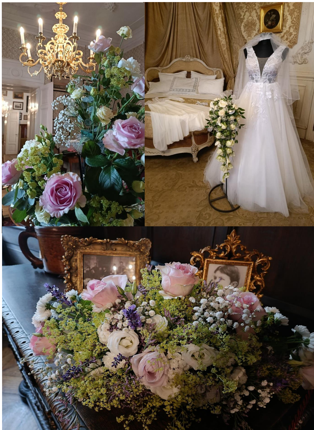
14. ročník „Svátky růží“ – Svatba

14. ročník Svátků růží v expozici prvního patra zámku s podtitulem „Svatba“ přivítal 1268 návštěvníků.