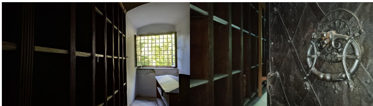
Bývalý zámecký archiv

Mimo to byla možnost i netradiční návštěvy zámeckých prostor v podobě nočních prohlídek, dětských hraných pohádkových prohlídek, kostýmovaných či vánočních prohlídek. Dále pak prohlídky tématicky zaměřené, ale přesto určené široké veřejnosti, pro omezený počet osob ve skupině „Rozšířené prohlídky zbrojnic“, „Rozšířené prohlídky obrazáren“, „Za kuriózními exponáty zámeckých sbírek“, „Exkluzivní prohlídky“ a prohlídky míst, do kterých běžně s návštěvníky nechodíme „Opočno opačně...“ – tentokrát jsme veřejnosti ukázali prostory bývalého zámeckého archivu, studniční věž – tzv. hladomornu a jízďárnu.