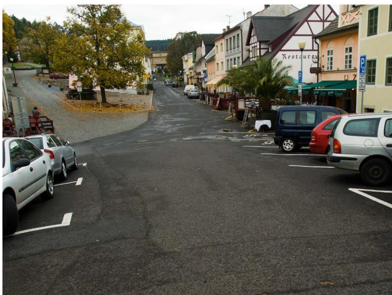
Obrázek 2 - Parkoviště

Hrad a zámek leží přímo v centru obce. Hrad a zámek spolu sousedí. Hrad bude opravován a pro veřejnost uzavřen až do roku 2019.