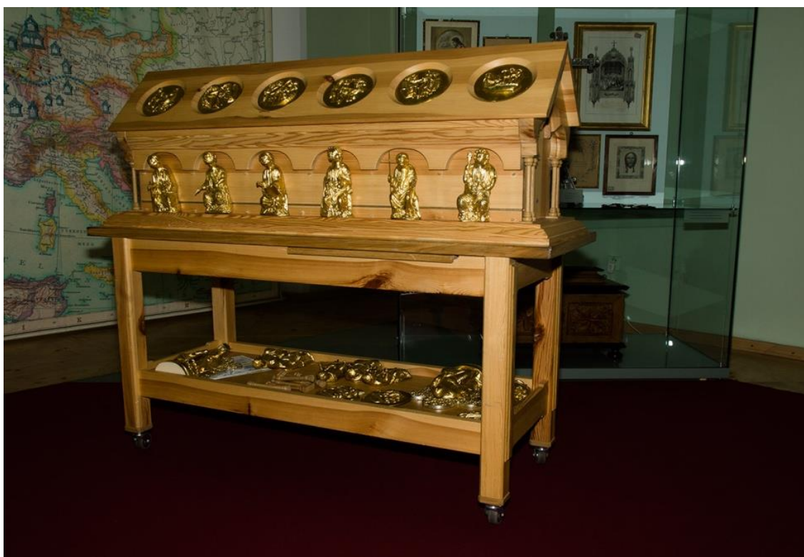
Obrázek 6 - Haptický model relikviáře

Na zámku probíhá několik různých prohlídkových okruhů. Absolvoval jsem, a to individuálně, prohlídku pro nevidomé s výkladem, "Relikviář Sv. Maura". Haptický model relikviáře je ve skutečné velikosti. Během výkladu si nevidomí maketu relikviáře ohmatávají, mají tak možnost prostorové představy a také mohou zkoumat kvalitu provedení sošek a reliéfů. Relikviář se skládá ze 14 odlitek sošek a 12 reliéfů, jak ukazuje fotografie níže.