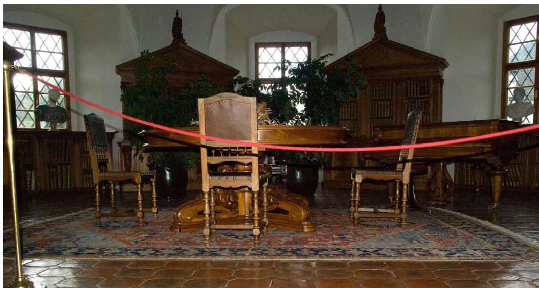
Obrázek 5 - Pohled na exponáty

Na zámku probíhá několik různých prohlídkových okruhů. Absolvoval jsem, a to individuálně, prohlídku pro nevidomé s výkladem, "Relikviář Sv. Maura". Haptický model relikviáře je ve skutečné velikosti. Během výkladu si nevidomí maketu relikviáře ohmatávají, mají tak možnost prostorové představy a také mohou zkoumat kvalitu provedení sošek a reliéfů. Relikviář se skládá ze 14 odlitek sošek a 12 reliéfů, jak ukazuje fotografie níže.