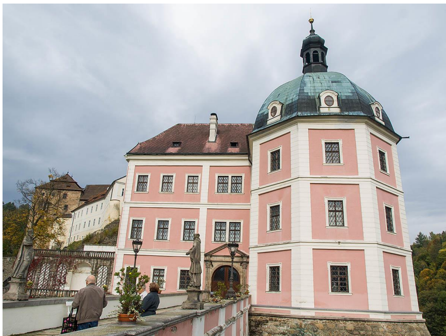
Obrázek 1 - Celkový pohled

Hrad a zámek leží přímo v centru obce. Hrad a zámek spolu sousedí. Hrad bude opravován a pro veřejnost uzavřen až do roku 2019.