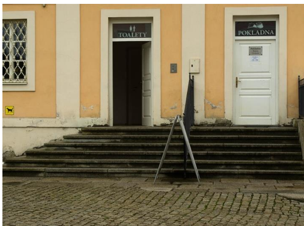
Obrázek 7 - Přístup k toaletám

Toalety vyhrazené pro handicapované návštěvníky na zámku nejsou. Přístup k toaletám je po schodech a s několikerými úzkými dveřmi. Pro tělesně postižené návštěvníky jsou přístupné jen s asistencí.