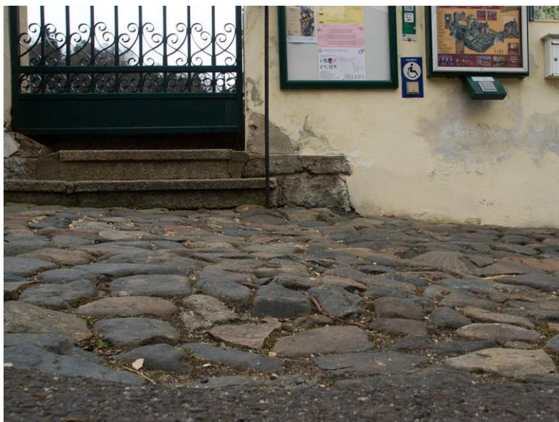
Obrázek 3 - Přístup ke zvonku

Mezi parkovištěm a zvonkem je asi 1 metr dlouhý, mírně se zvyšující kamenitý povrch, který návštěvníkům na vozíku přístup ke zvonku mírně komplikuje.